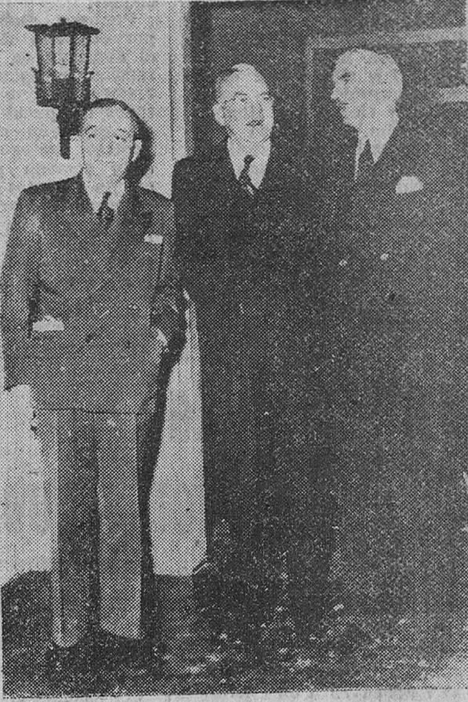
Bidaul, Foster Dulles y Eden, (por este orden, de izquierda a derecha), reunidos poco antes de comenzar una de las sesiones de la Conferencia de los "cuatro grandes" en Berlín.

Plan occidental para terminar con la actual división de Europa También han propuesto una reunión sobre Corea en Ginebra