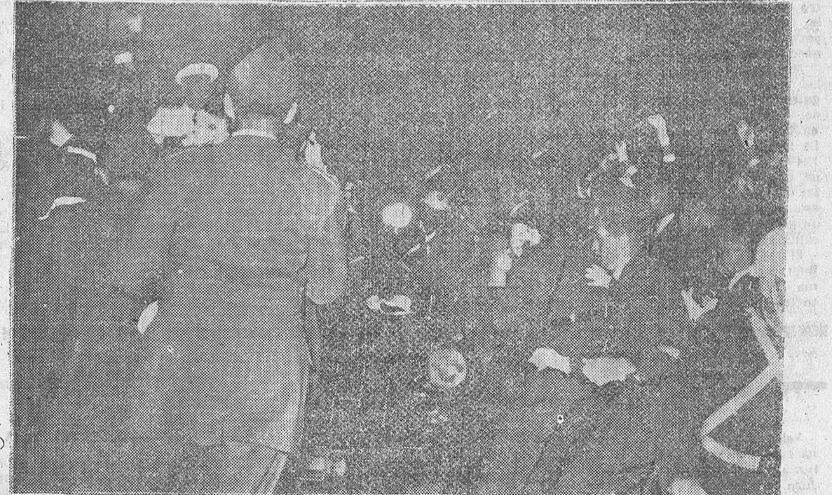
Su Excelencia el Jefe del Estado saluda efusivamente al excelentísimo señor Arzobispo de la diócesis, en la forma que recoge nuestra primera fotografía. En el grabado inferior uno de los momentos del triunfal paso del Caudillo por el paseo del Espolón.