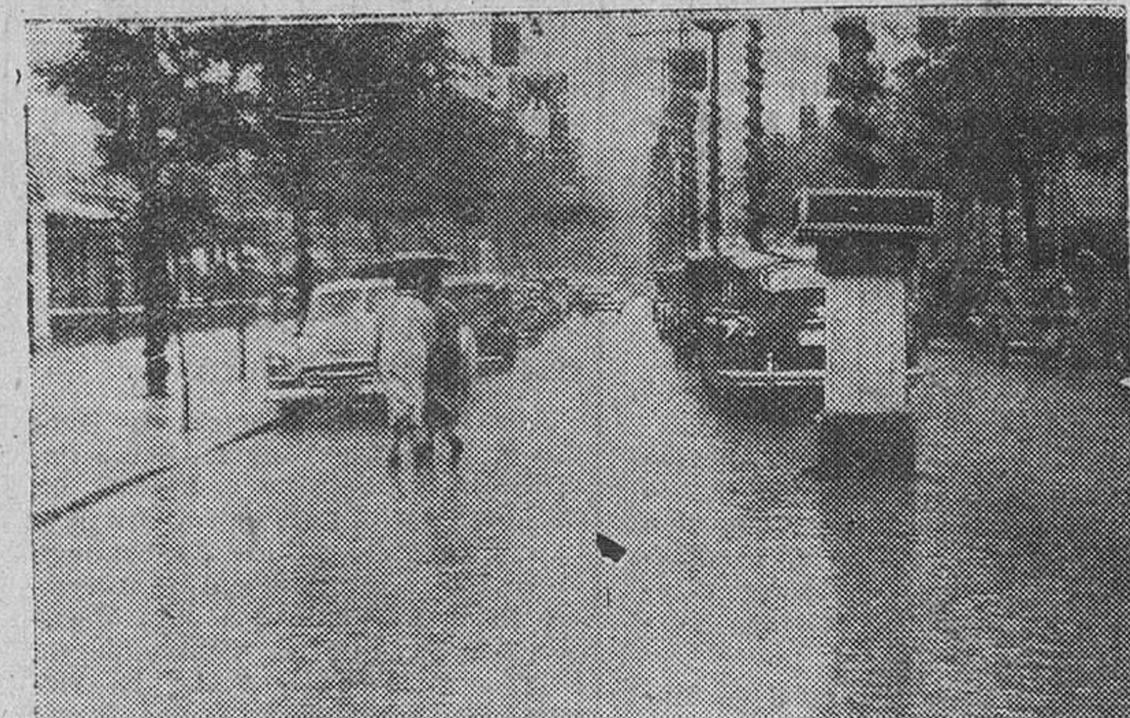
Sevilla.—Descargó el domingo sobre esta ciudad, intenso y continuo aguacero, obligando a aplazar hasta ayer martes el comienzo de la tradicional feria de Abril. En el Real de la Feria, los impermeables y paraguas componen una estampa nortea, sobre el pavimento salpicado por la lluvia.

La Feria de Abril sevillana aplazada por las lluvias