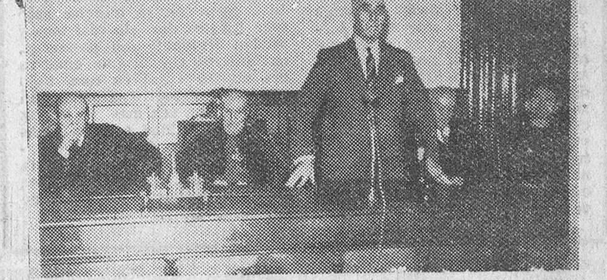
Con gran solemnidad se celebró el domingo la clausura del Curso de Verano de la Institución "Francisco Suárez". En nuestros grabados, las autoridades nacionales, vizcainas y burgalesas, a la salida de la misa que tuvo lugar en la Catedral. Al pie, el subsecretario de Justicia, en su discurso, final de la sesión académica.