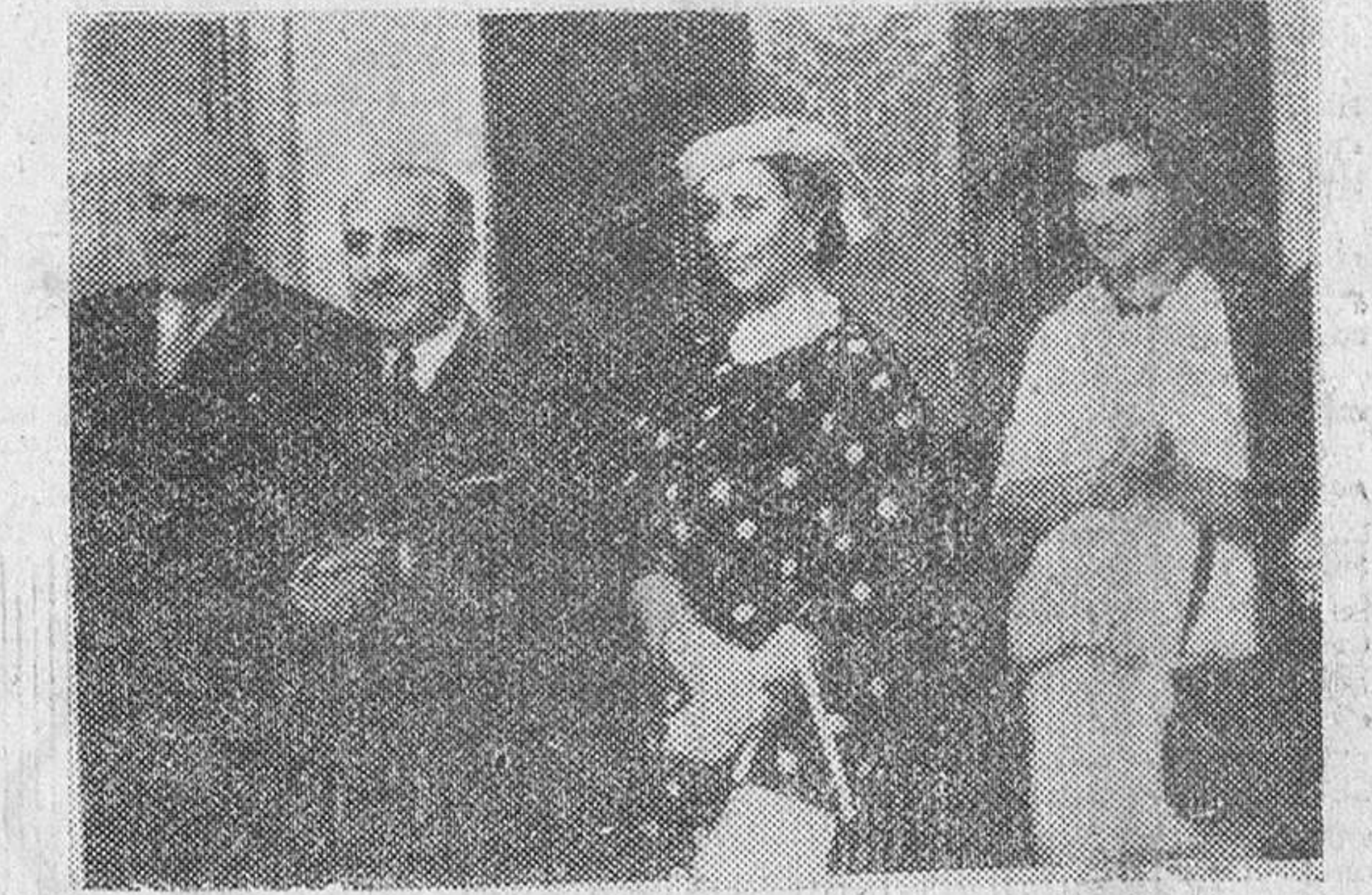
Entrega de premios por el Caudillo. La Coruña.— Su Excelencia el Jefe del Estado y su esposa e hija, asistieron, desde el Club Náutico, a las regatas y entregaron los premios a las embarcaciones vencedoras.

"Finalmente, debemos tener en cuenta que existe en otros países determinado número de personas que verían encantadas el fracaso de nuestras negociaciones. Por eso tienen interés (Pasa a quinta página.)