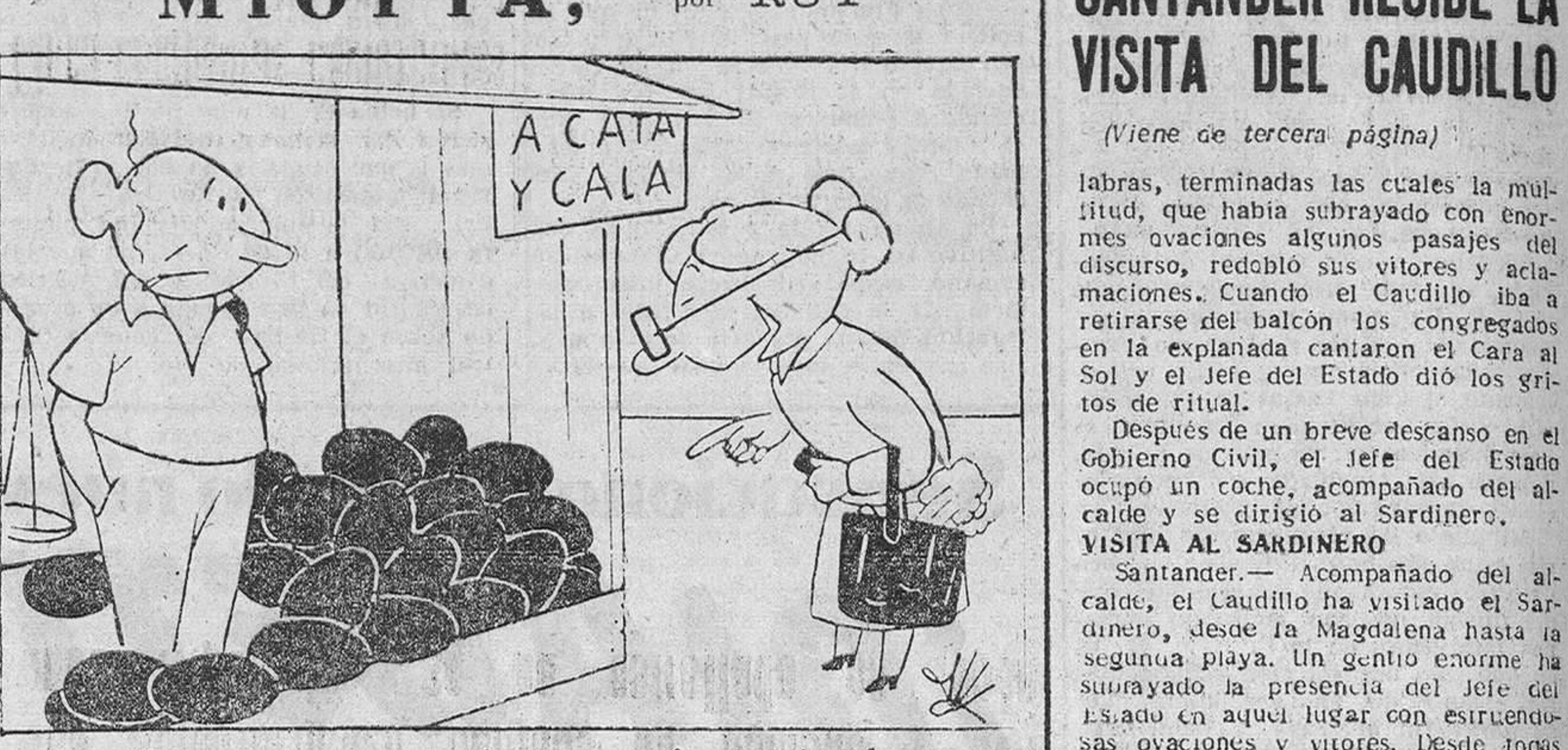
—Déme una peseta de esas aceitunas tan hermosas