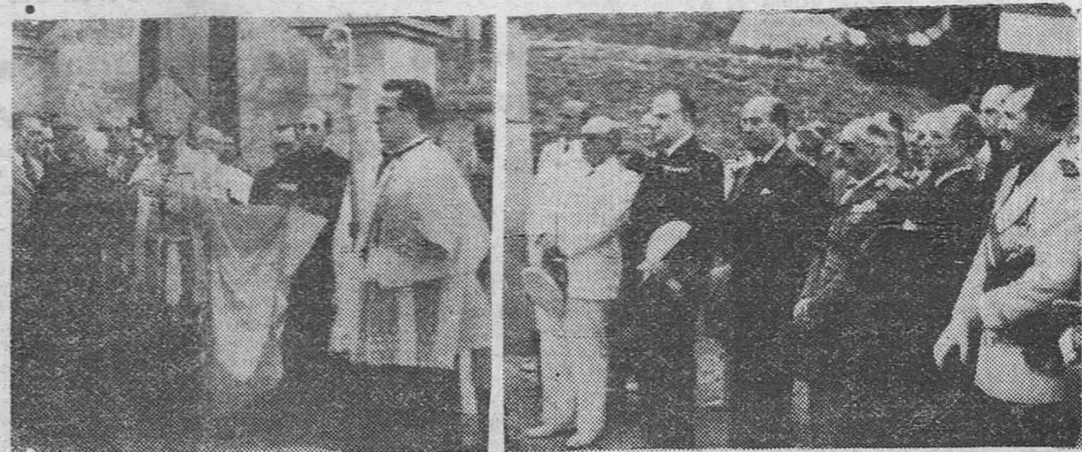
El Excmo Sr. Arzobispo de Burgos procediendo a la bendición del pantano del Ebro, bajo la presidencia de S. E. el Jefe del Estado que, en unión de los ministros de Obras Públicas, Comercio, capitán general accidental de la Región y gobernador civil de Burgos, aparece en la segunda fotografía.

En la bendición de la magna obra ofició nuestro Rvdmo. Prelado S. E. el Jefe del Estado escuchó con el mayor cariño los problemas de Arija Santander, donde llegó anoche, le tributó un triunfal recibimiento