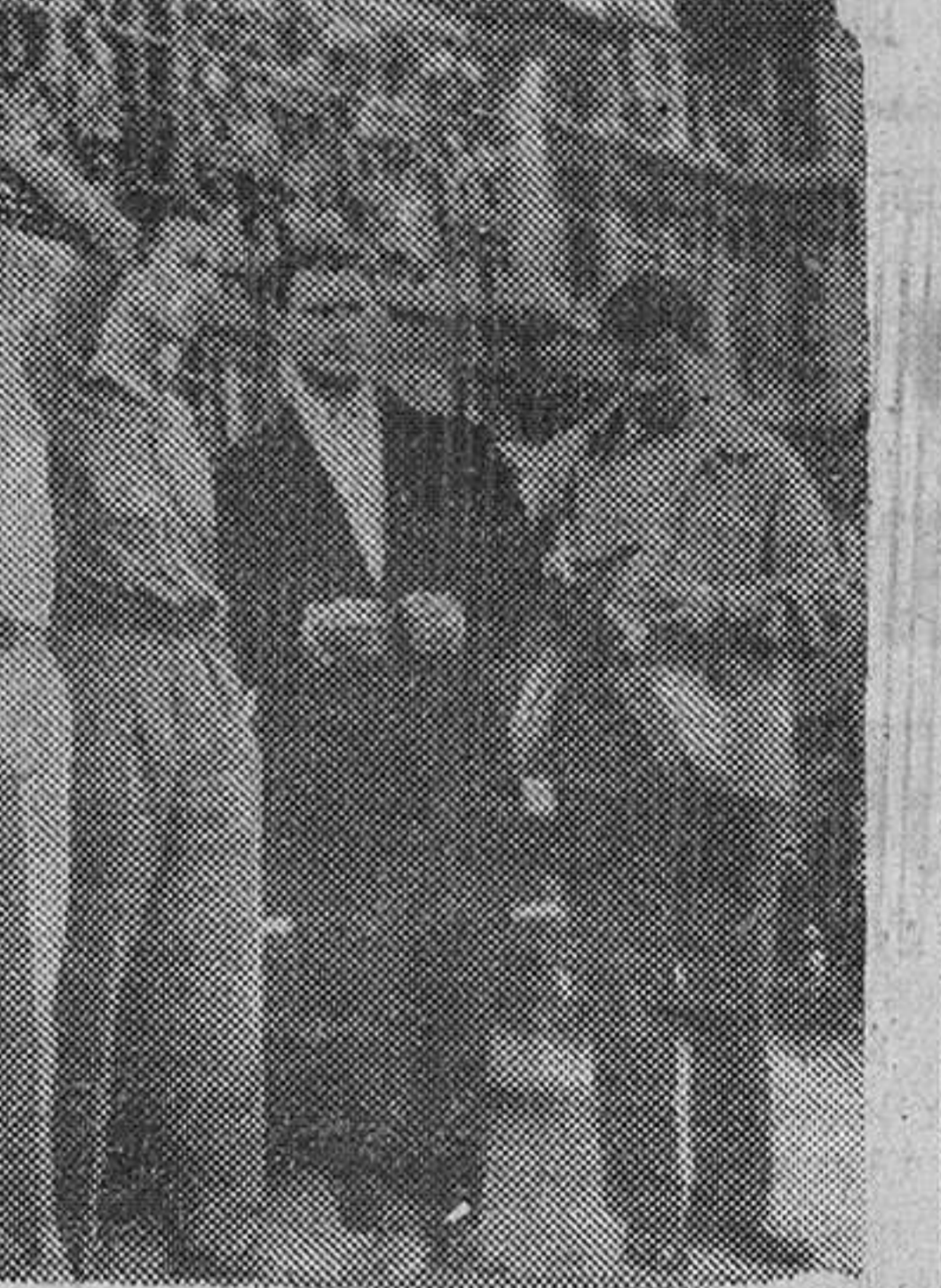
Van a intentar la ascensión del monte Ararat

Un apoyo práctico de los Estados Unidos.—Efe.