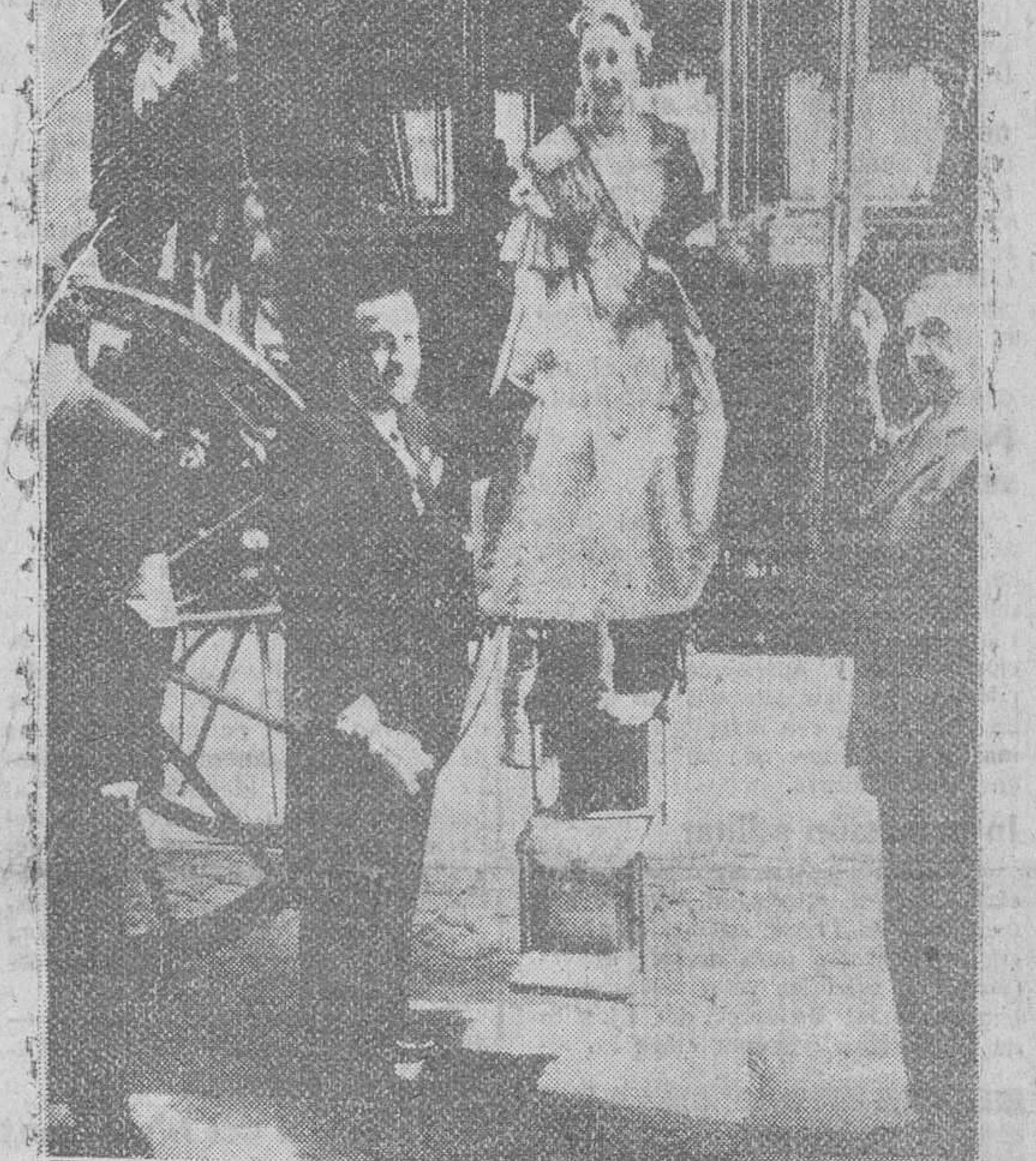
Valencia.— La fallera a la llegada al Ayuntamiento desciende de la carroza, ayudada por el presidente de la Junta Central Fallera, para saludar al pueblo desde el balcón central.