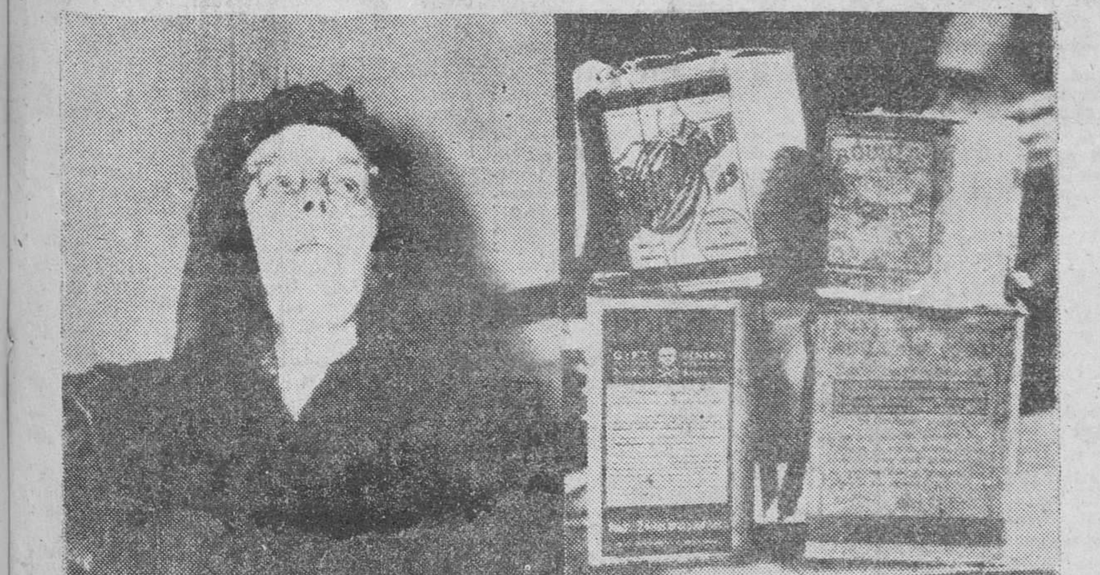
ACUSADA DE HABER ENVENENADO A DOCE PERSONAS procedida en una actitud durante la vista de la causa y las piezas de convicción presentadas por la acusación

(Información del acto en tercera página)