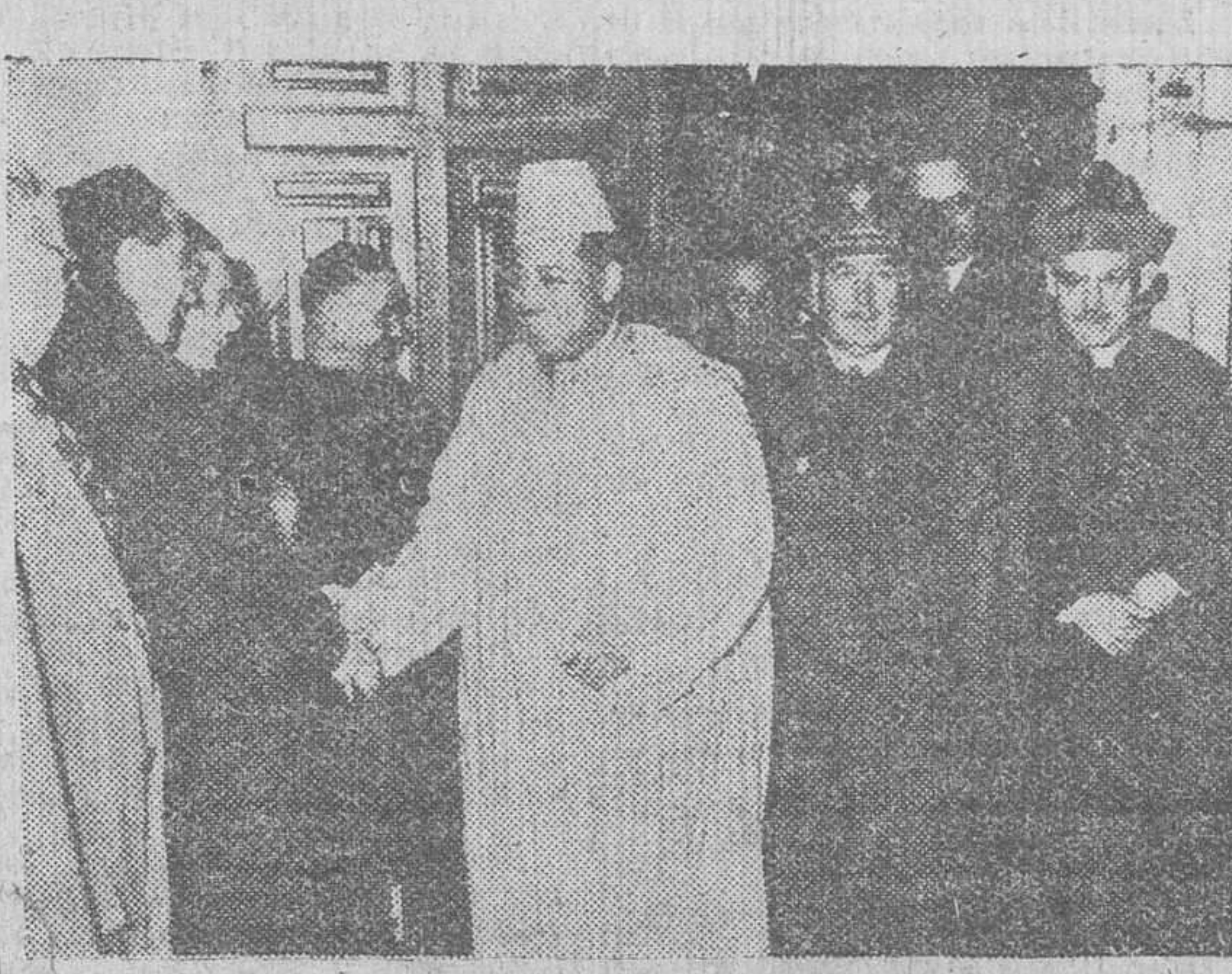
Teruán. S. A. I. el Jalfia acompañado del Alto Comisario, teniente general García Valiño, y otras personalidades, a la salida de la iglesia parroquial de Nuestra Señora de las Victorias, donde asistió a un concierto de música sacra dirigido por el maestro Guridi.