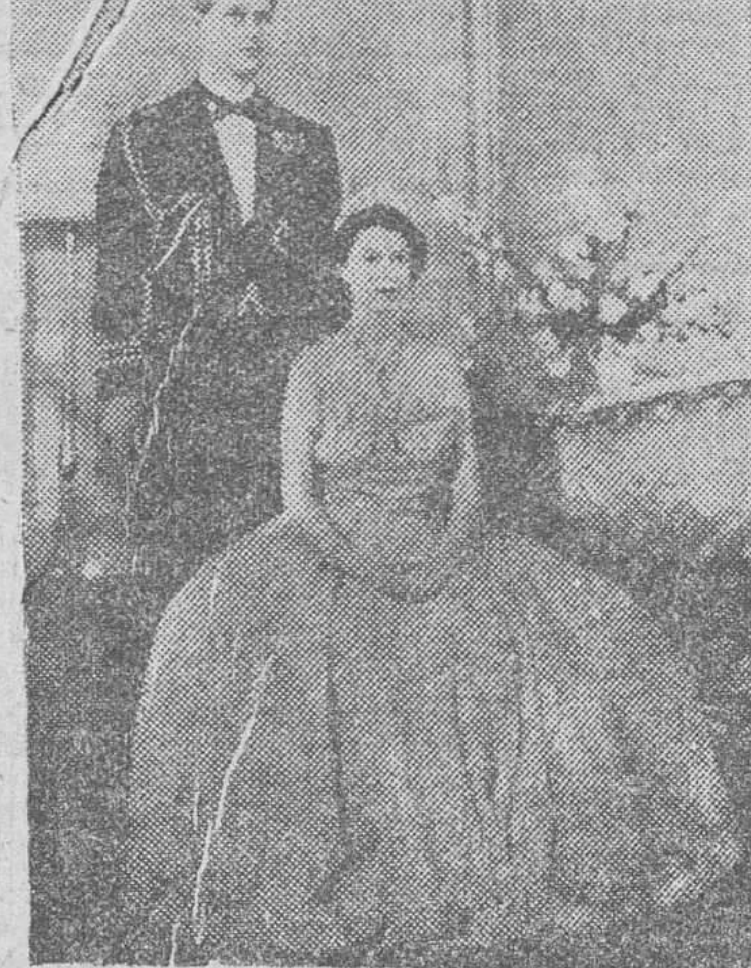
La Reina Isabel II de Inglaterra y su esposo, el duque de Edimburgo.

Previamente, la Soberana juró su cargo ante el Consejo privado