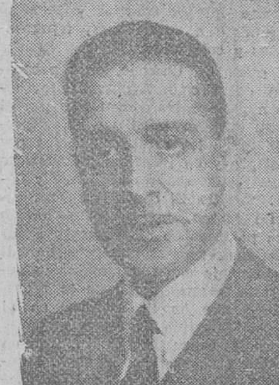
EL MINISTRO DE HACIENDA

EWALGA DE DESPACHOS Madrid.—En la Escuela naval de Guerra se ha celebrado esta mañana la entrega de los despachos a ocho jefes y oficiales que han terminado sus estudios de especialistas de Estado Mayor de la Armada.