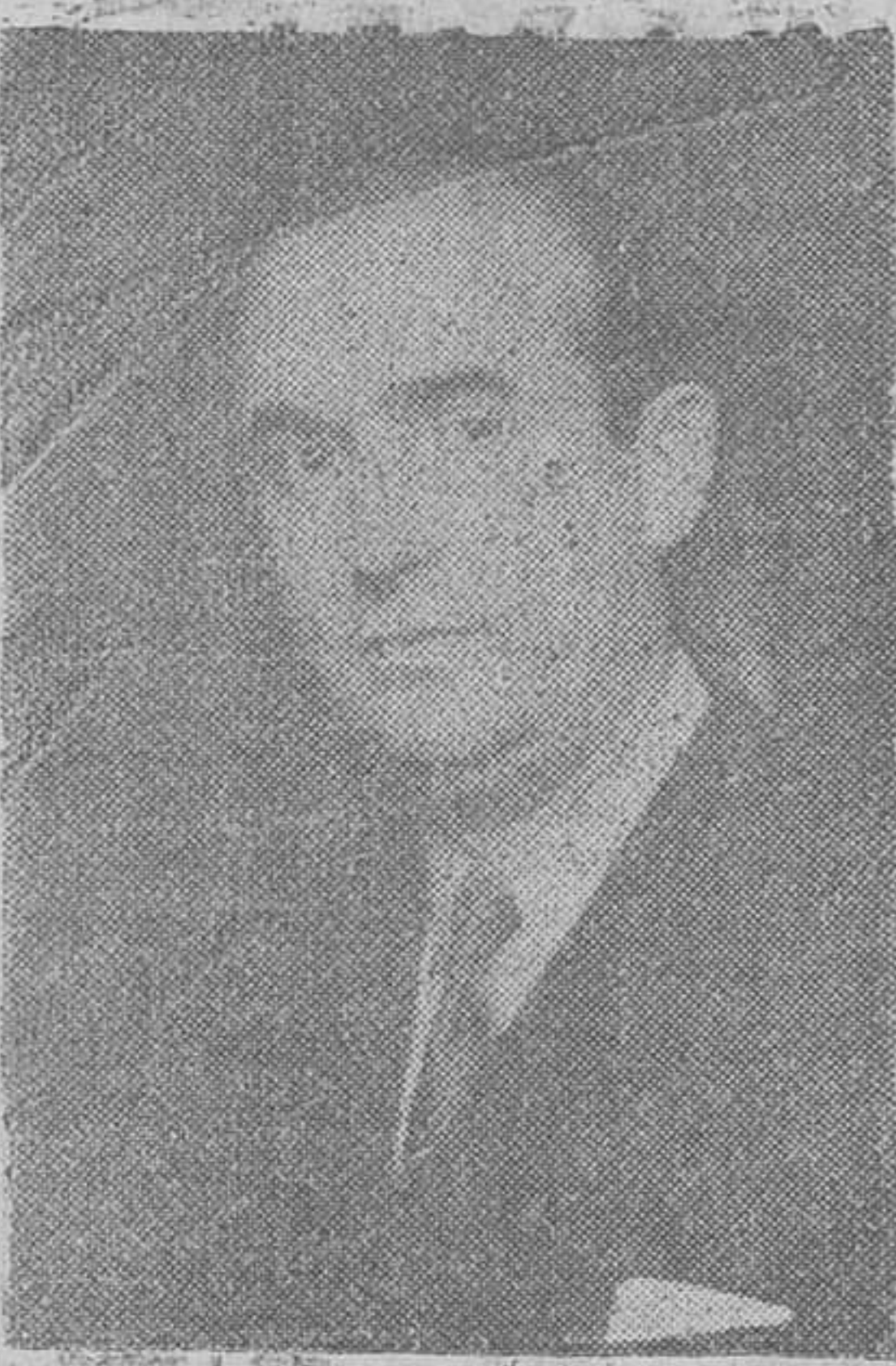
EL MINISTRO DE COMERCIO

Seis miembros del Gobierno prestaron juramento como procuradores en la sesión plenaria de ayer