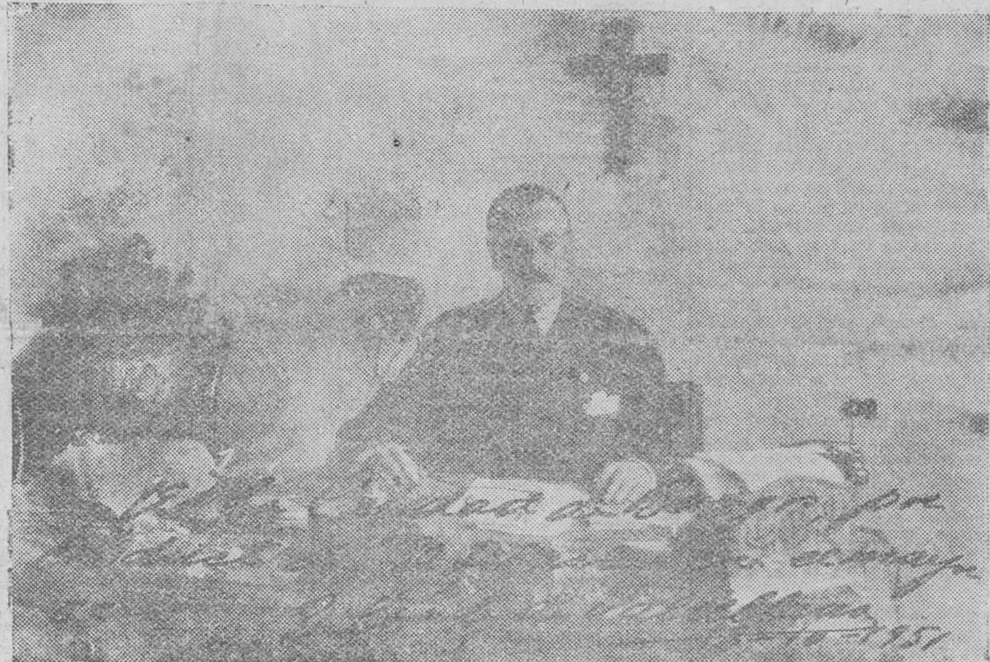
El Excmo. Sr. Ministro de Obras Públicas, accediendo a nuestro ruego en tal sentido, ha honrado a este periódico permitiéndole que sea portavoz de su saludo anticipado para la Ciudad de Burgos, ante la visita que en el día de hoy inicia a nuestra capital y provincia. El texto del autógrafo que ilustra las presentes páginas, es como sigue: "A la Ciudad de Burgos, por conducto de "EL DIARIO", con el mayor cariño. — El Conde de Vallellano. — 13-10-1951".

El conde de Vallellano saluda a los burgaleses en un autógrafo firmado para DIARIO DE BURGOS