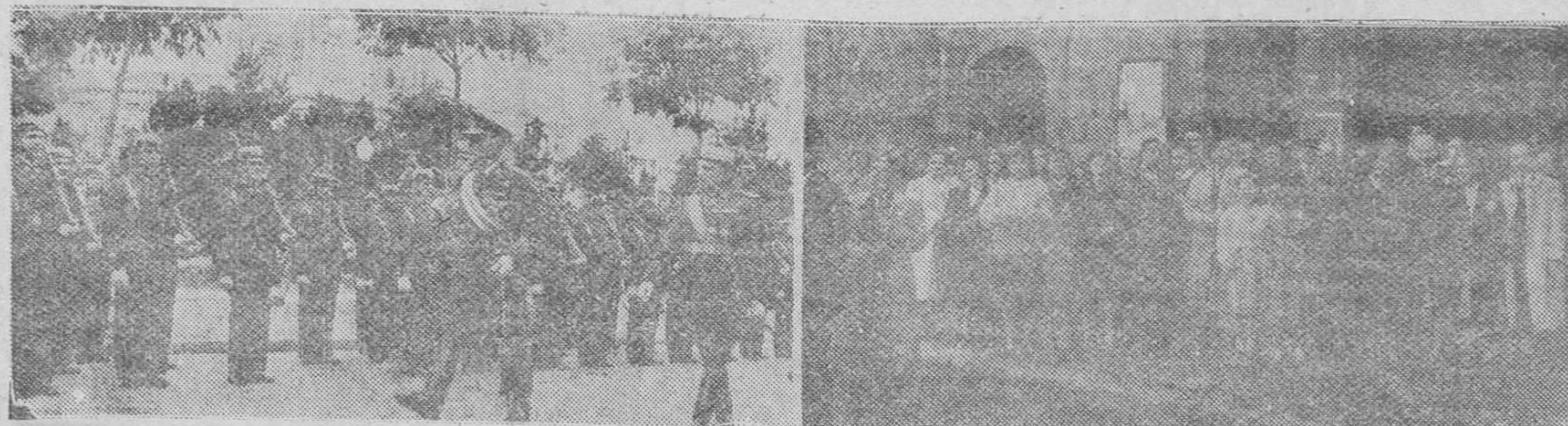
Dos documentos gráficos de la festividad de ayer en Burgos. — A la izquierda, el general Rodríguez Boriado, gobernador militar de la plaza, revisando a las fuerzas de la Guardia Civil que formaron ante la Iglesia de la Merced, con motivo de la fiesta de su Patrona. — A la derecha, funcionarios de Correos rodeados por sus familiares, después de la misa celebrada en honor de Nuestra Señora del Pilar.