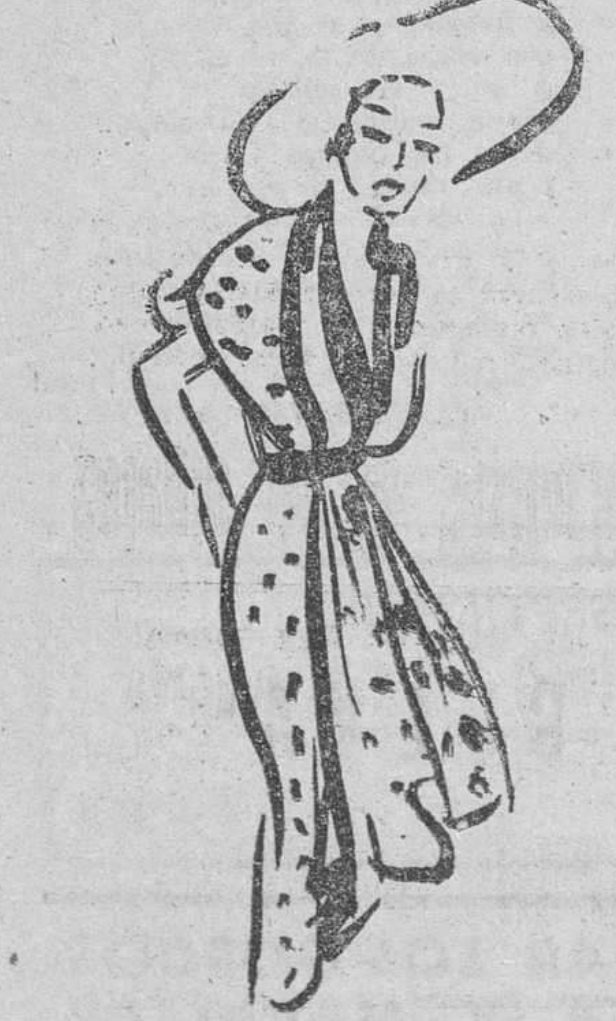
Vestido de surah blanco con lunares negros (Creación Jean Dessès).

PARIS. Septiembre. (Exclusiva para DIARIO DE BURGOS). Mientras veía en la rue de la Paix la colección que el español Castillo ha hecho en Lancin, pensaba que sus vestidos, que él denomina, según creo, vestidos de sorpresa, no son ni más ni menos que la traducción de un te-