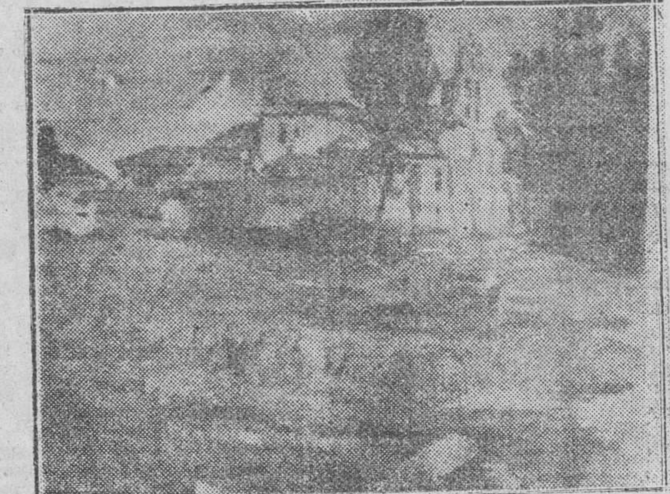
Alrededores de San Lesmes

ascendimiento y en trabajo a sus ochenta y cinco años cumplidos. Y una vez más, también, cuando ya finaliza su estancia en Burgos, hemos querido que nuestros lectores sepan del fruto sorprendente que la actividad incansable del gran maestro ha conseguido en los dos meses de su permanencia en esta capital.