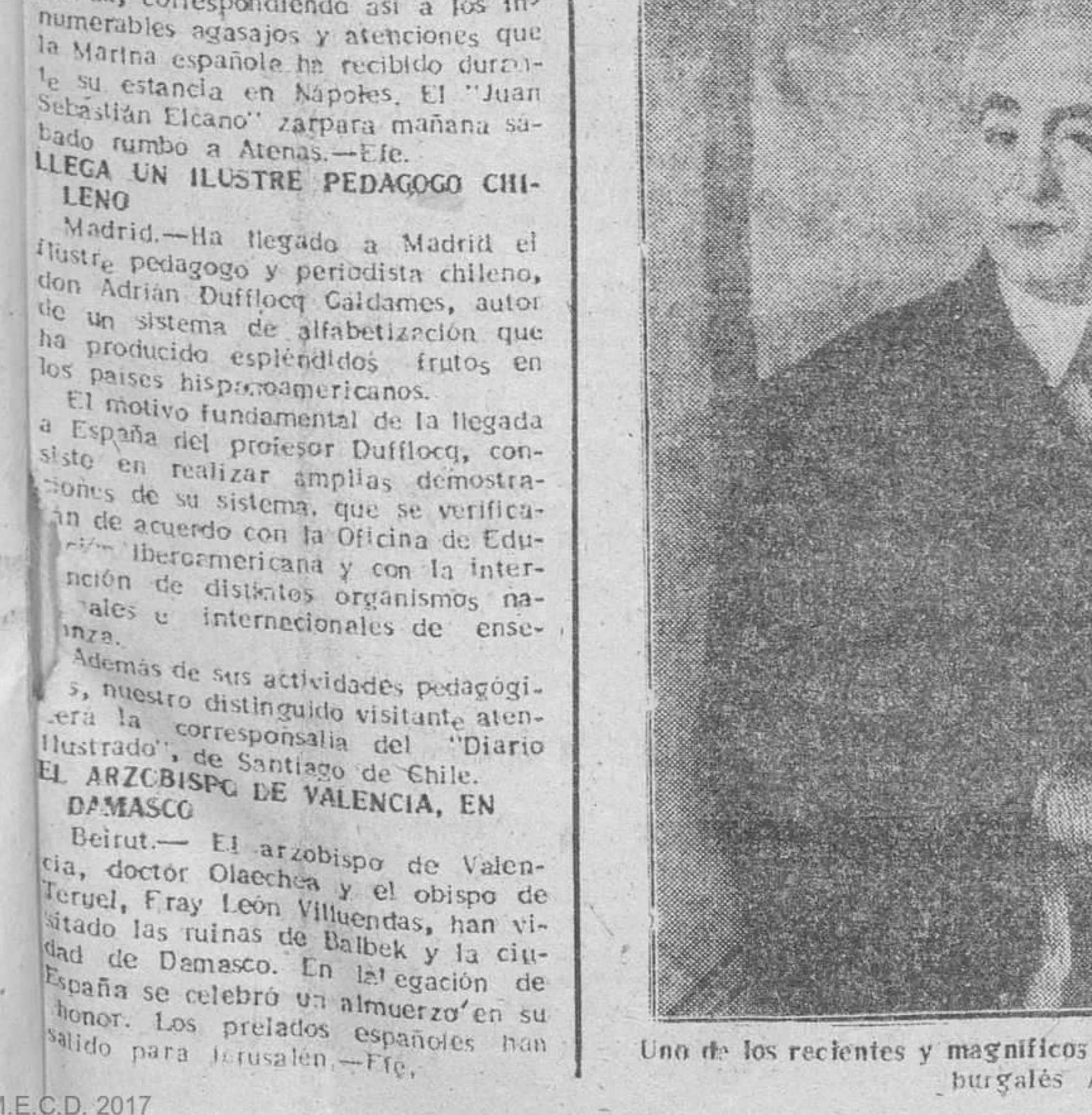
Uno de los recientes y magníficos retratos de que es autor el joven pintor burgalés Aurelio Blanco.