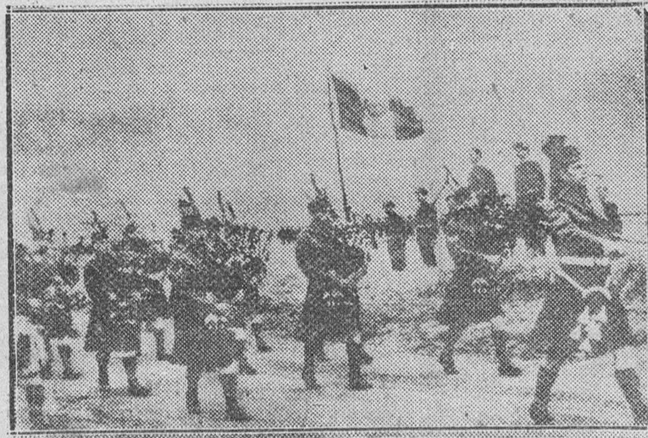
El Ministerio de la Guerra británico ha anunciado que la 28 Brigada de Infantería releva a la 27 Brigada británica, que combate en Corea. La 27 Brigada está formada por un batallón del Regimiento de Middlesex y el primer batallón de Argyll. Fueron las primeras tropas enviadas por Inglaterra a Corea. He aquí a los gaiteros escoceses del batallón de Argyll que pasaron sus clásicos uniformes y sus típicas canchones a lo largo y a lo ancho de la Península coreana.

Después, monseñor Carol Abbin, de Irlanda, pronunció su conferencia sobre «Crisis de la Educación y causas de la misma».