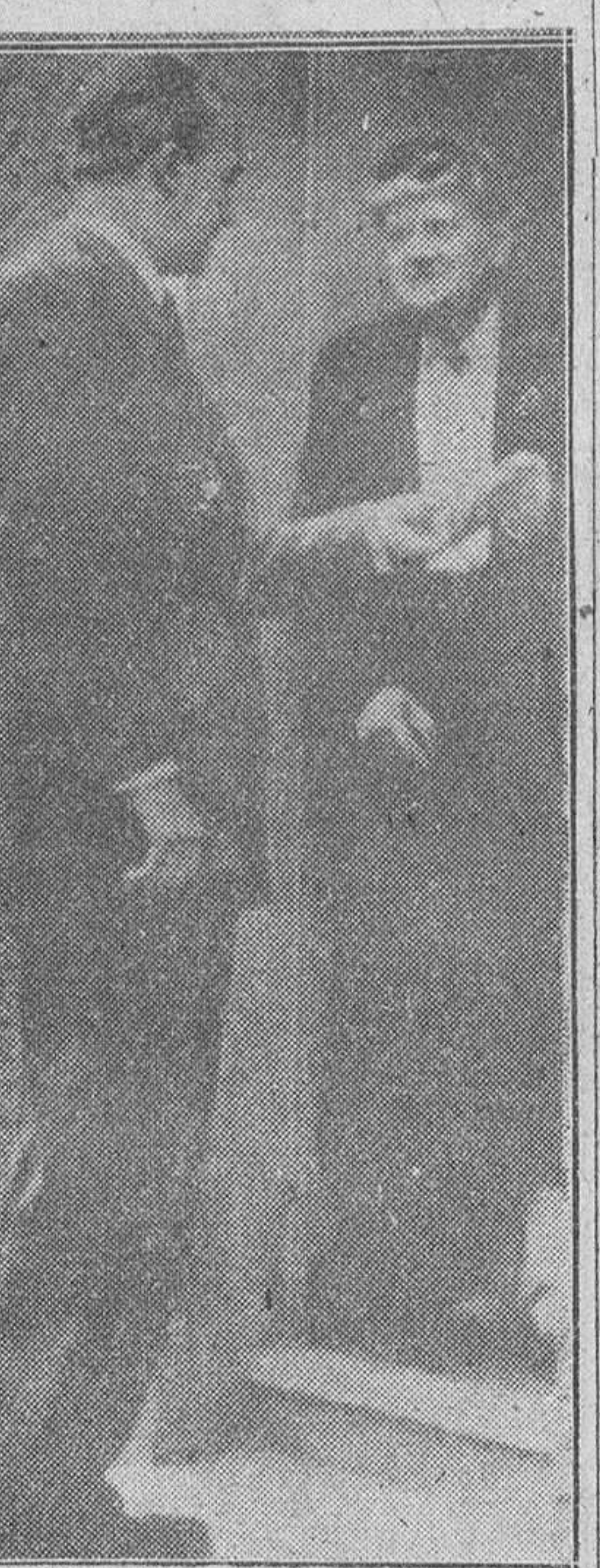
Isla de Yeu. — Mme. Petain y su hijo, esperan la llegada del coche que les trasladará al fuerte de Pierre Levee, para permanecer junto al lecho del anciano Mariscal, gravemente enfermo.