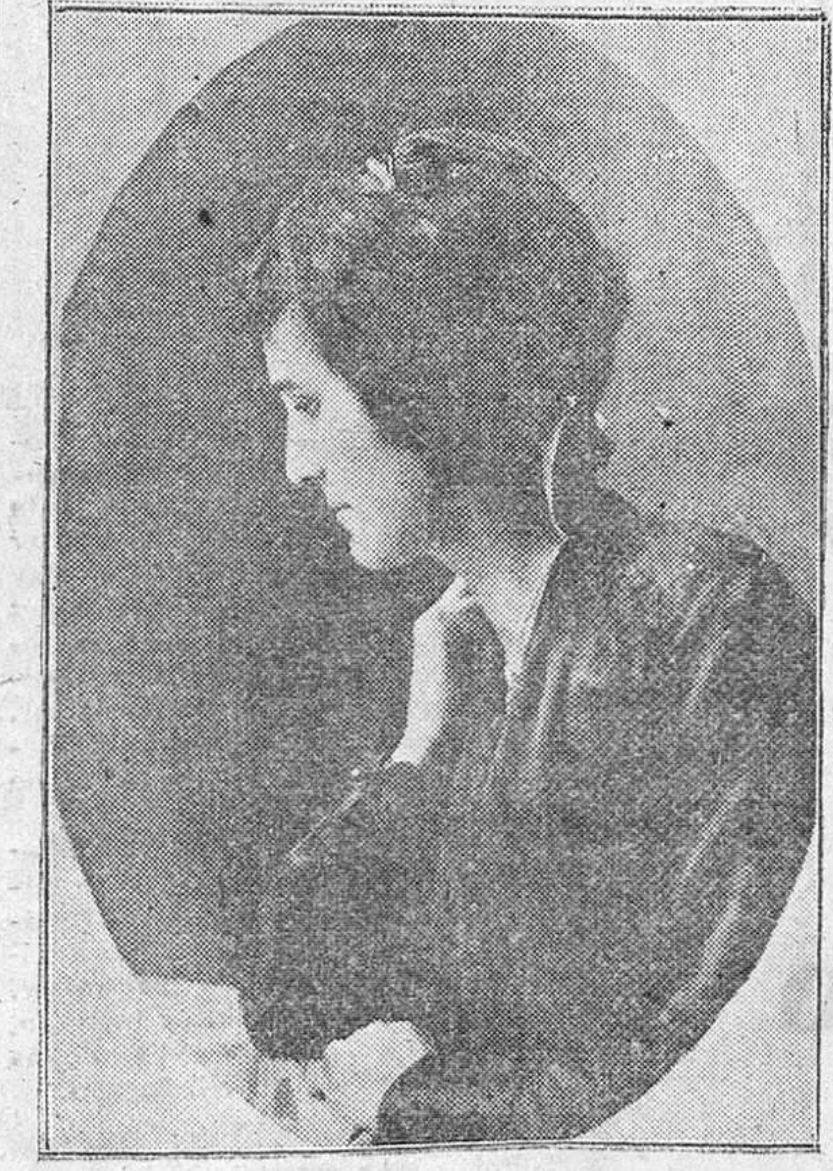
LA ESPOSA DE ROMMEL EN LA EPOCA DE SU MATRIMONIO

temberg, en Weingarten, como "aspirante", es decir, más o menos como cadete oficial, lo cual significaba que había de servir en la tropa antes de ingresar en la Kriegsschule o Academia Militar. En Octubre ascendió a cabo y en Diciembre a sargento. En Marzo de 1911 fue enviado a la Kriegsschule de Dantzig.