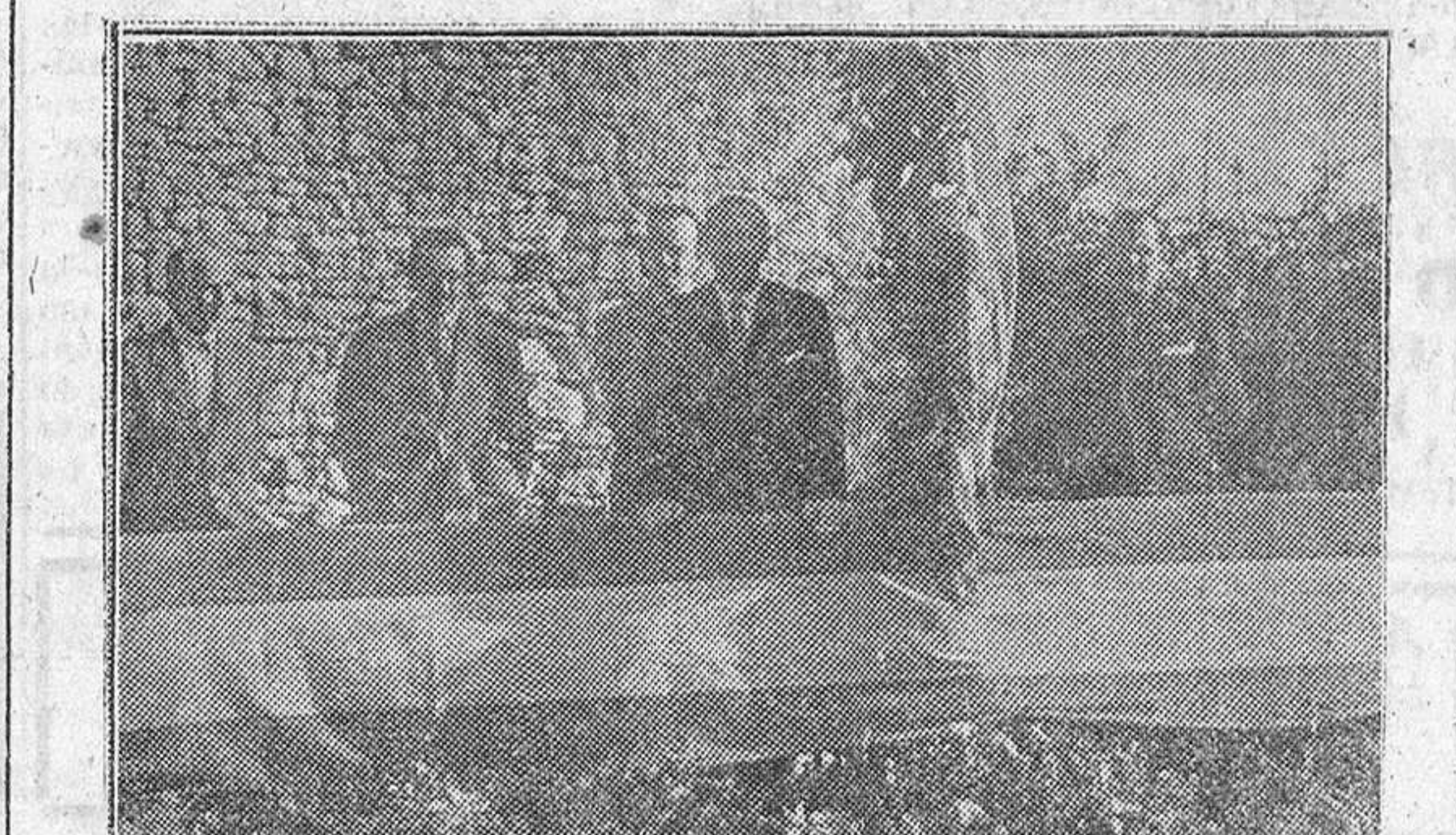
EL JUEVES ULTIMO PRESIDIO EL EXCELENTISIMO SEÑOR GOBERNADOR CIVIL Y JEFE PROVINCIAL DEL MOVIMIENTO DE LA INAUGURACION DEL SERVICIO DE ENERGIA ELECTRICA EN LAS ALDEAS DE VALLUJERA Y ICHUHO, AGRUPACIONES VECAINAS DEL VALLE DE TOBALLINA Y CUESTA URRIA, CUYAS OBRAS HAN SIDO REALIZADAS BAJO EL PATROCINIO DE LA JUNTA TECNICA. EN LA FOTO DE "FEDE" APARECE EL SEÑOR RODRIGUEZ DE VALCARCEL DIRIGIENDO LA PALABRA AL VECINDARIO DE VALLUJERA