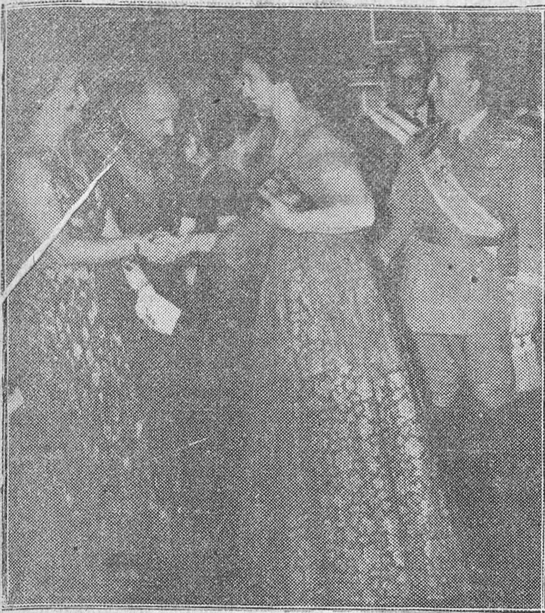
SAN SEBASTIAN.—AL LLEGAR AL PALACIO PROVINCIAL ACOMPAÑADO DE SU ESPOSA, EL CAUDILLO SALUDA A LAS DISTINGUIDAS PERSONALIDADES E ILUSTRES DAMAS QUE ESPERABAN SU LLEGADA.

S. E. EL JEFE DEL ESTADO EN SAN SEBASTIAN