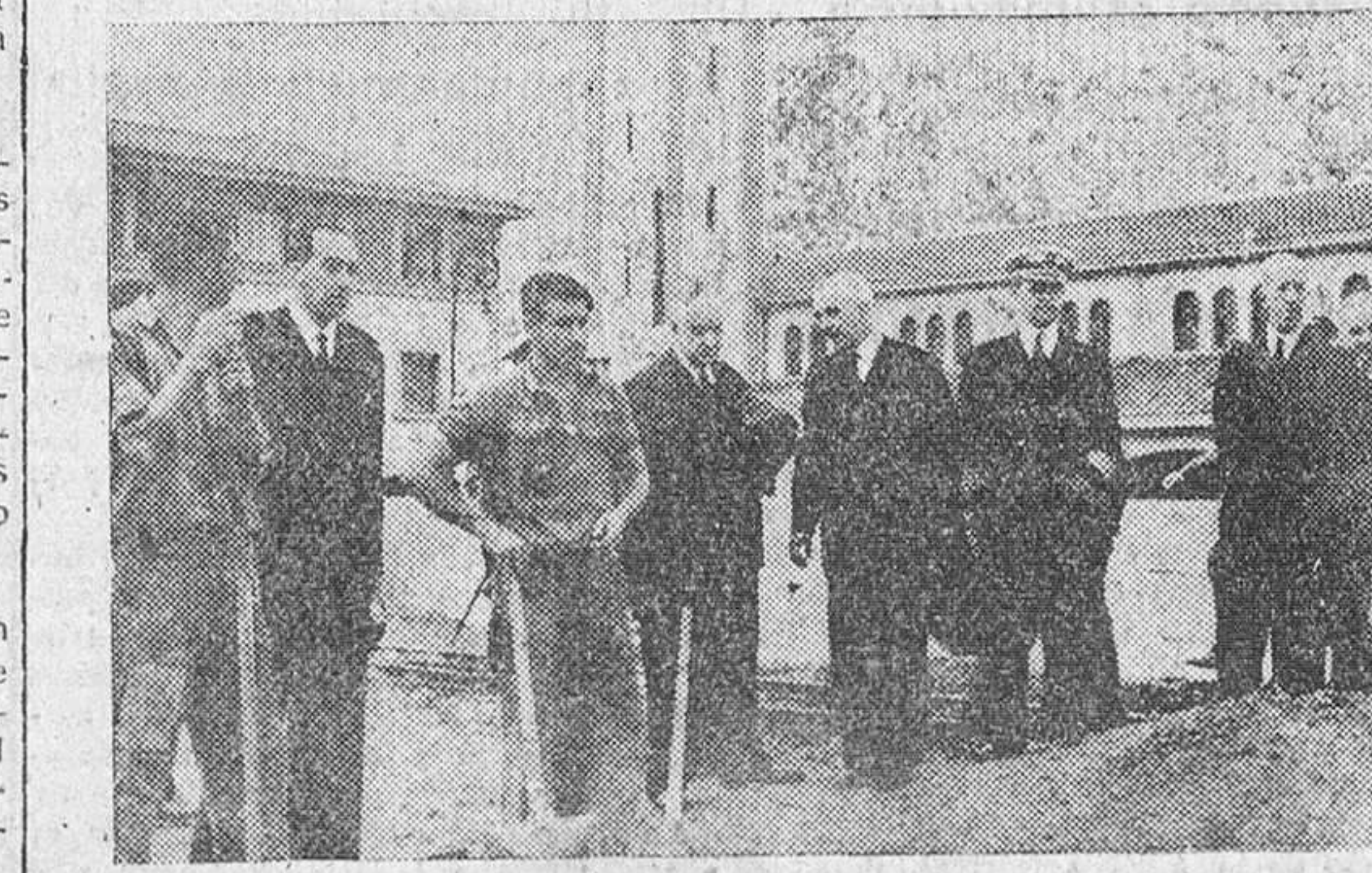
BILBAO.—EL MINISTRO DE OBRAS PÚBLICAS, SR. FERNANDEZ LA DREDA EXAMINA LOS IMPONENTES MOVIMIENTOS DE EXCAVACION DEL EQUIPO DE MODERNISMAS EXCAVADORAS QUE SE UTILIZAN EN LAS OBRAS DEL CANAL DE DEUSTO, QUE SE REALIZAN ACTUALMENTE