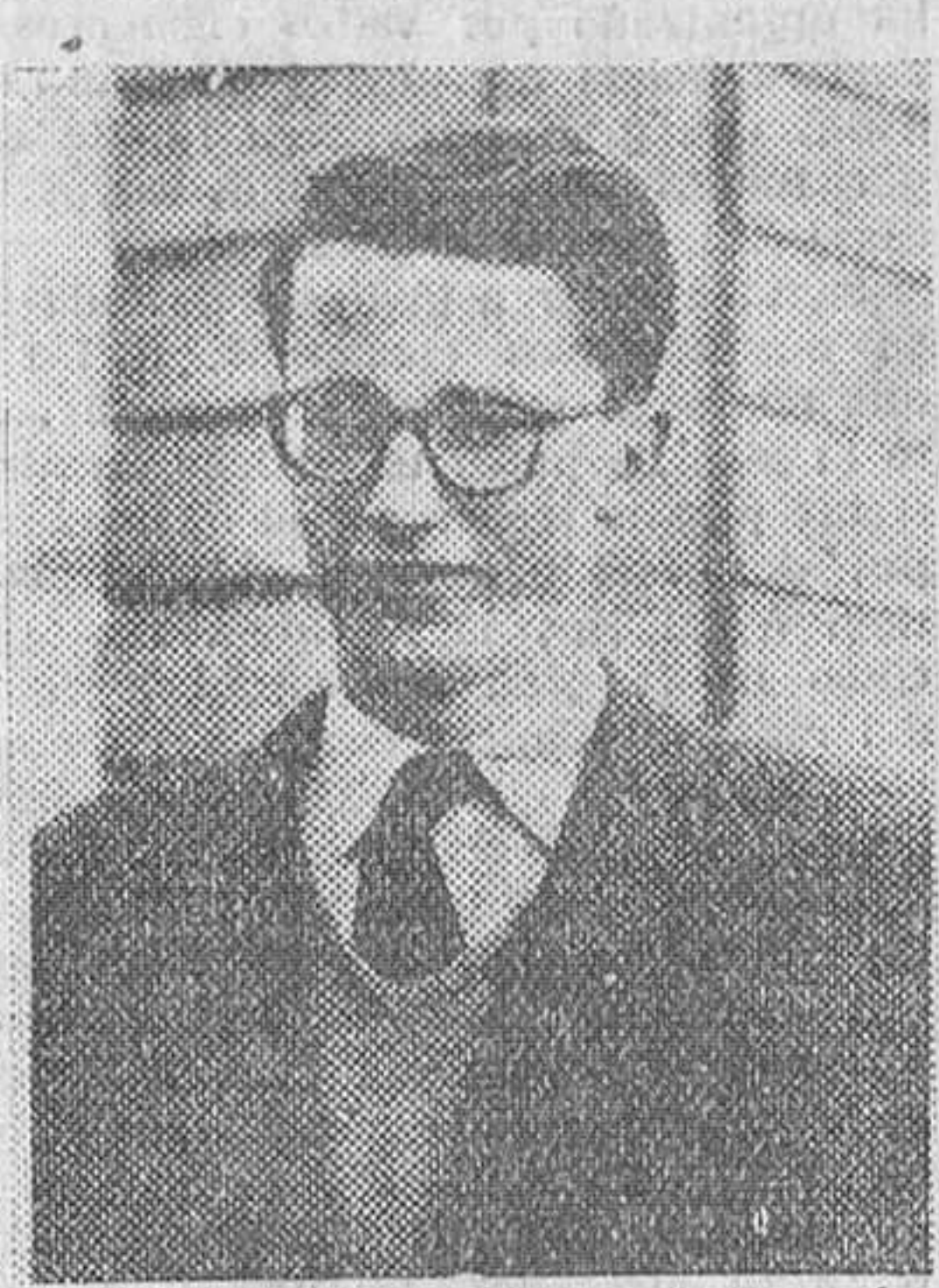
EL PRINCIPE BALDUINO, HIJO DEL REY LEOPOLDO DE BELGICA.

Bruselas.—Los poderes que el Rey Leopoldo transmitirá a su hijo, el Príncipe Balduino, son teóricamente mayores que los del Monarca inglés y menores que los del presidente norteamericano.