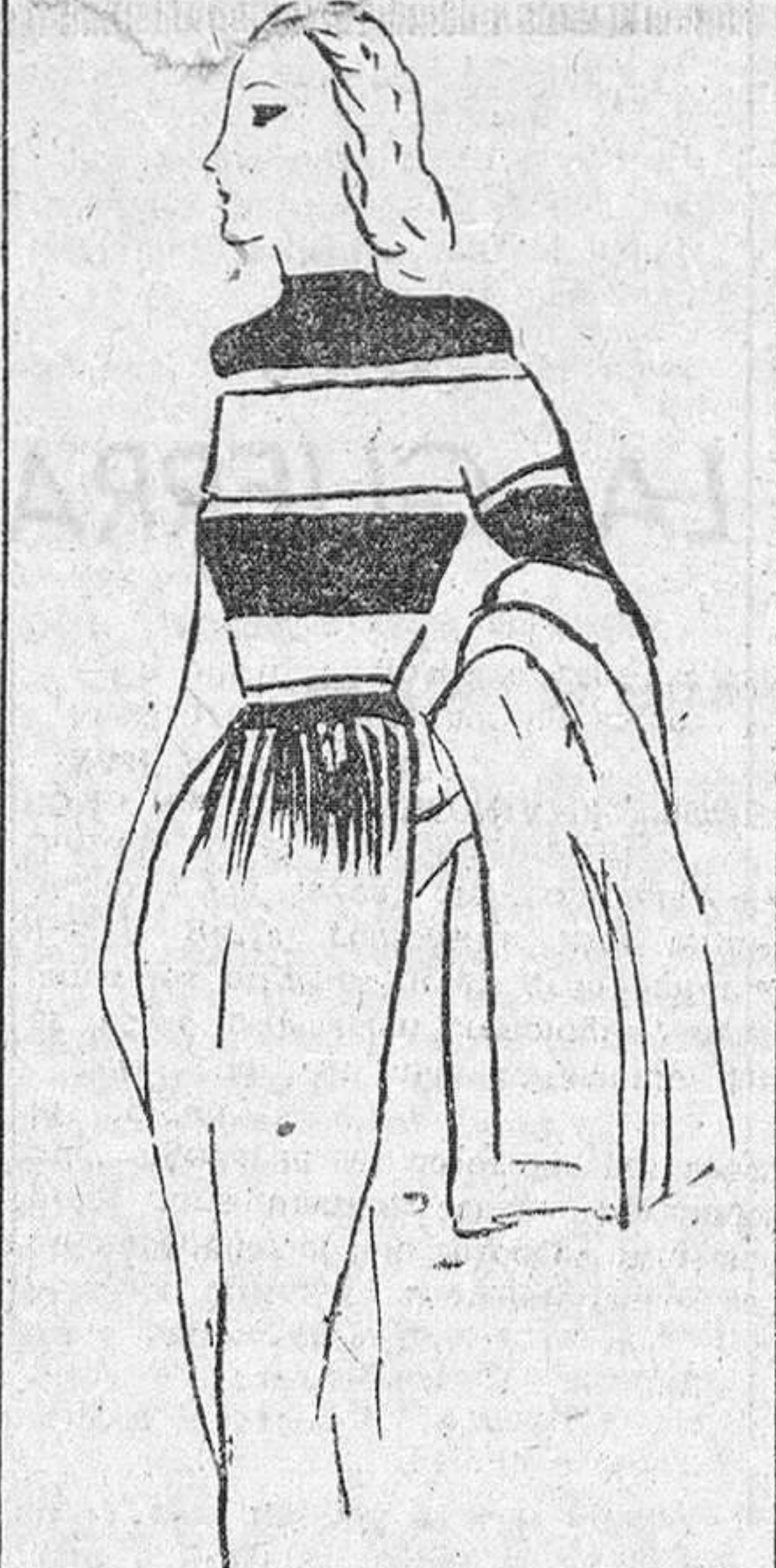
Para el "yachting", conjunto de chaqueta y pantalón de franela blanca, con "pull over" rayado de blanco y azul marino.

desde los guantes, que ahora se combinan con antlope y paja trenzada, hasta los pañuelos de seda deslizados a anudarse en la abertura de la chaqueta, y que suelen ser de tonos claros, sobre todo amarillos, estampados con herraduras, o con cabezas de caballo. El yachting.—Este deporte exige, más que ningún otro, un traje clásico pantalón de seda y llena de joyas. O un traje de pirata de película. Esto puede servir de regocijo para toda la travesía. La faldita corta, plegada, de franela o de lino, propone una seria batalla al pantalón masculino; sin embargo, parece que sea éste el que gana, ya sea estrictamente masculino, o bien claros estilo napolitano, o sea ceñido y corto hasta debajo de la rodilla, lo que exige una línea impecable. Otro modisto nos muestra un pantalón de corsario, completado por tirantes que dejan la espalda desnuda, todo ello de tela de lino encarnado. O un pantalón de lino negro, estilo corsario, con una marinera de lino color naranja. O un pantalón "slack" llevado con blusa estilo camiserio. Y para los días de tormenta, un abrigo de tela impermeable, de un amarillo intenso. Pañuelos de algodón estampado, sandalias de cuerda o de cuero, guantes de tricel blancos, con los accesorios necesarios para el traje de "yacht". (Propiedad Literaria Asegurada. Prohibida la reproducción.)