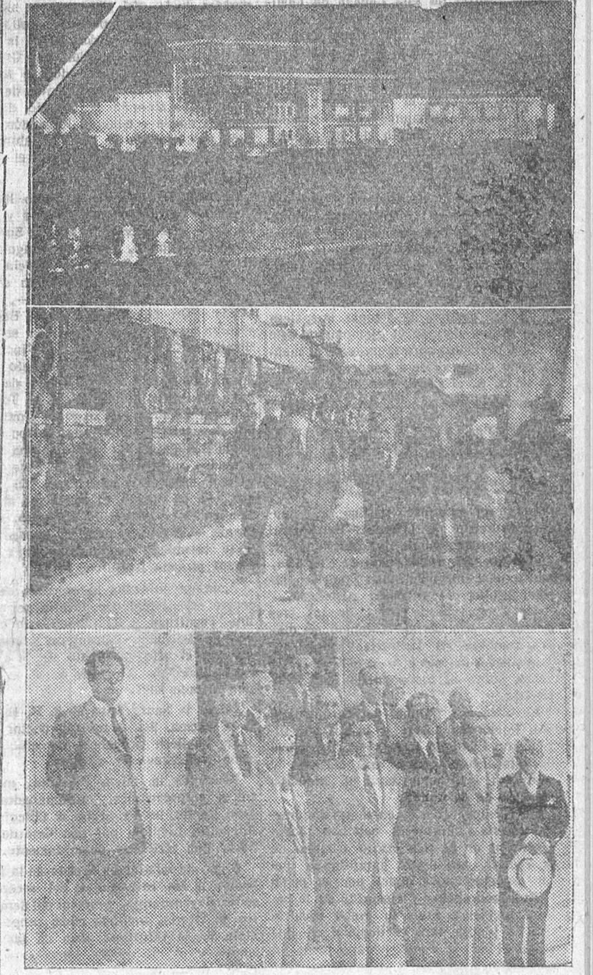
En nuestras fotografías aparecen: una perspectiva de la nueva fábrica de la Moneda, un momento de la visita efectuada a sus instalaciones por los miembros de su Consejo de Administración y un grupo de éstos a la salida de la fábrica.