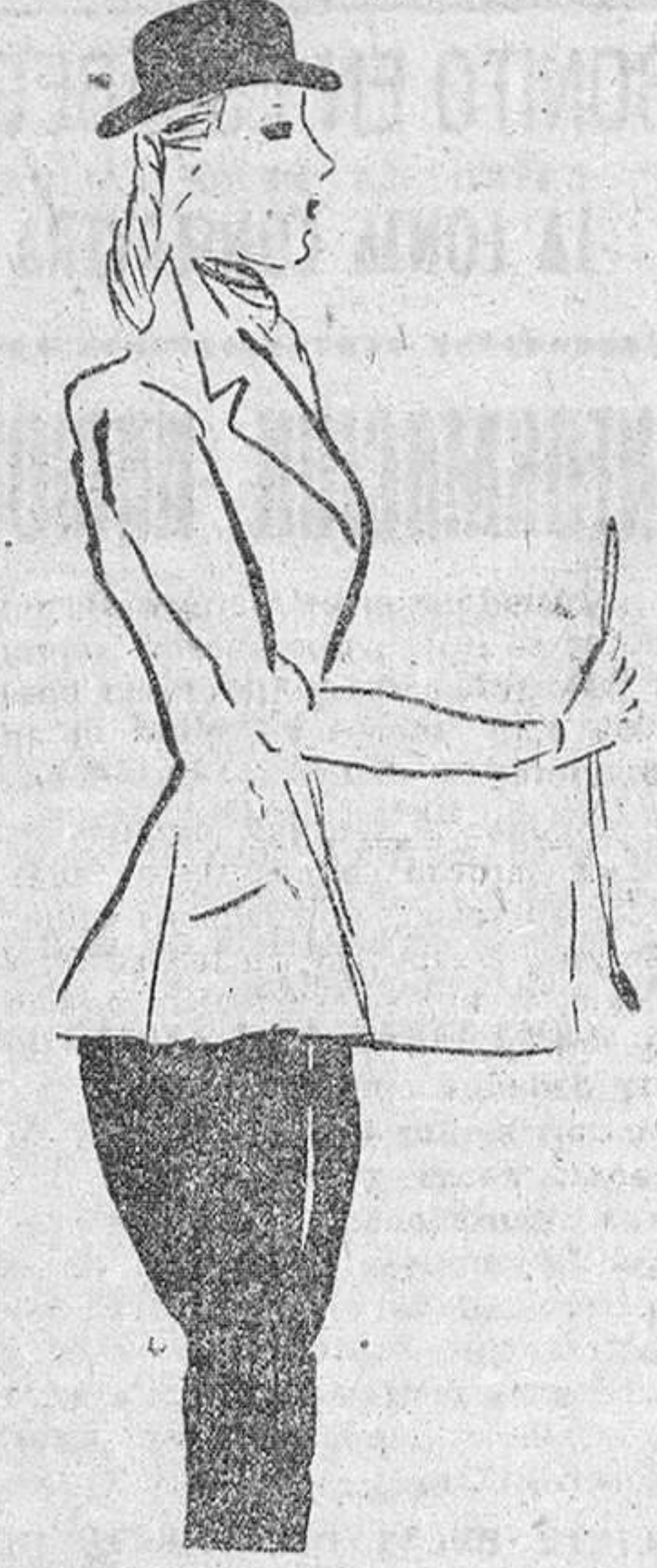
Para la equitación, nuestra cronista, que cultiva este deporte, recomiendo una chaqueta de tussor blanco, con faldita de "whipcord" negro.

REAPERTURA DEL FAMOSO CASINO DE BELLEVUE. — LOS GRANDES MODISTOS SE HAN DADO CITA EN LA COSTA. VASCA. — DESDE CRISTIAN DIOR A MADAME GRÉS. — DEPORTES DE VERANO. HUYAMOS DE LAS "TOILETTES" DE TIPLE DE GREPETA. — SERIEDAD EN EL VESTIR.