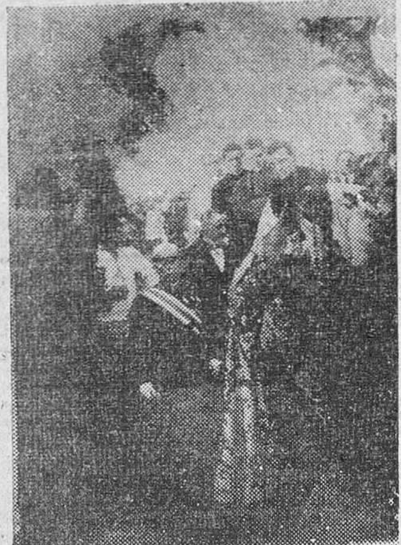
MOMENTO EN QUE EL EMMO. CARDENAL BENLLOCH BENDICE, EN 20 DE JULIO DE 1922 LA PRIMERA PIEDRA DEL SEMINARIO QUE MAÑANA SERA INAUGURADO