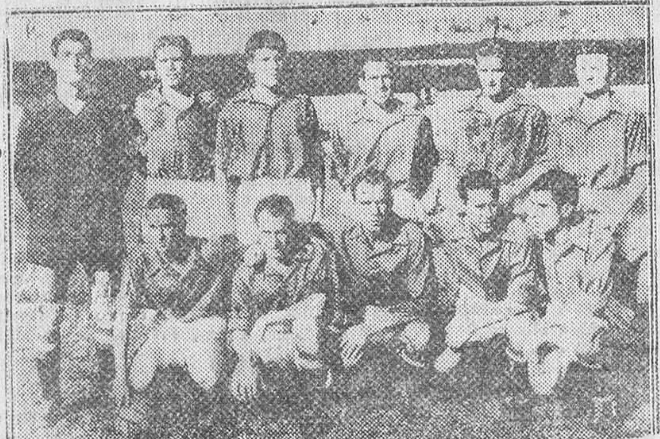
EL EQUIPO NACIONAL ESPAÑOL, TENIENDO COMO FONDO LAS INMENSAS GRADAS VACIAS DEL ESTADIO MUNICIPAL, ANTES DE SU PARTIDO CONTRA CHILE.

(En tercera y cuarta páginas, amplia información de la Agencia MENCHETA).