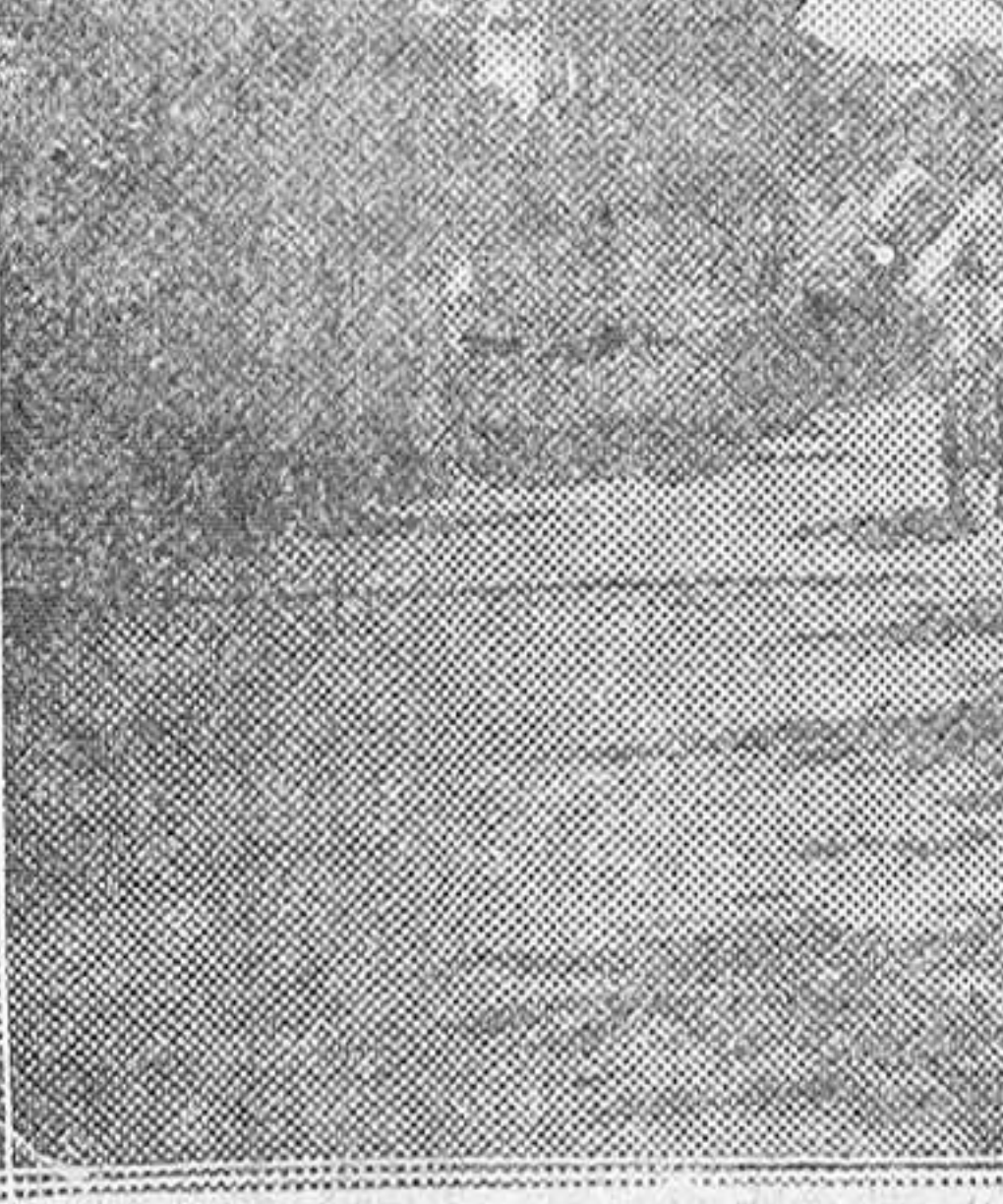
TUVO LUGAR EL DOMINGO UNA BRILLANTE PRUEBA DE REGULARIDAD PARA MOTOS. EN NUESTRA FOTO, UN MOMENTO DE LA CARRERA, QUE FUE PRESENCIADA POR GRAN GENTIO.