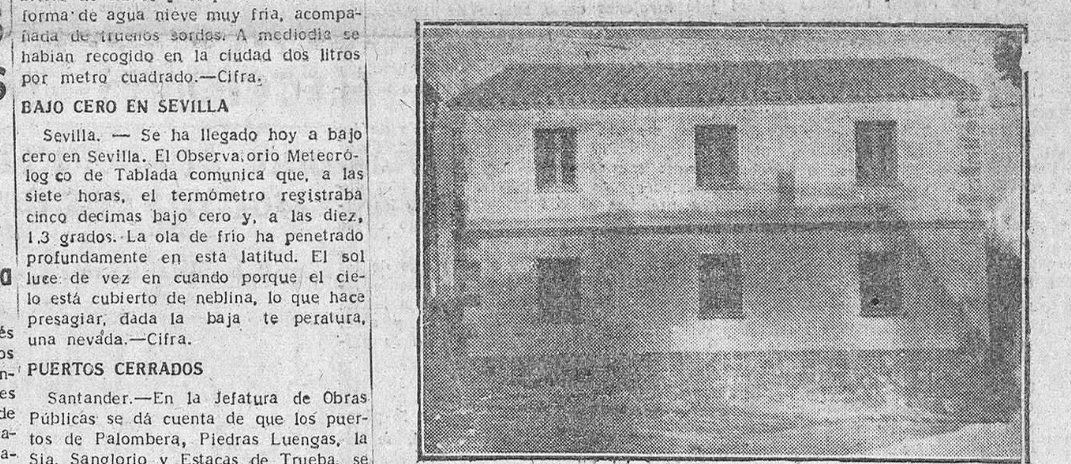
Ayer fueron inauguradas por el Gobernador civil y jefe provincial del Movimiento en Hortigueta dos viviendas para funcionarios. En la foto se reproduce el edificio inaugurado. (Información en tercera página).