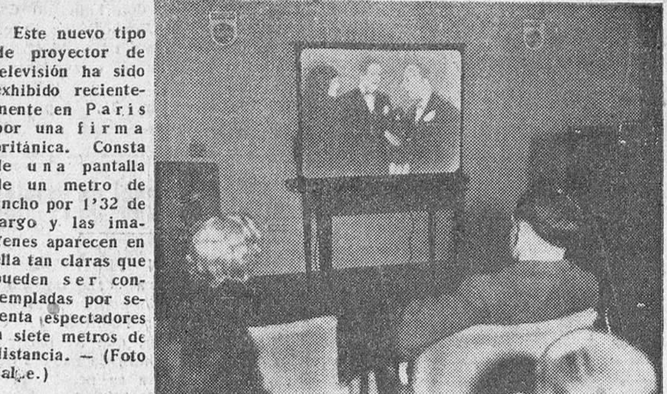
Este nuevo tipo de proyector de televisión ha sido exhibido recientemente en París por una firma británica. Consta de una pantalla de un metro de ancho por 1'32 de largo y las imágenes aparecen en ella tan claras que pueden ser contempladas por setenta espectadores a siete metros de distancia.