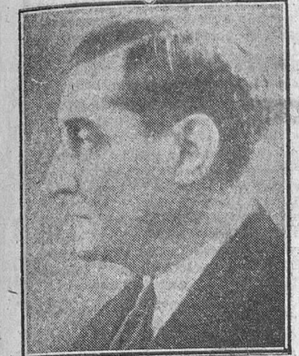
DOCTOR OLIVEIRA SALAZAR

Lisboa.—La jornada electoral para la Asamblea Nacional, que tendrá carácter constituyente, transcurrió con toda tranquilidad, y al mediodía había acudido a las urnas el cincuenta por ciento del censo. Por lo general, los primeros votantes no hicieron su aparición hasta las nueve y media.