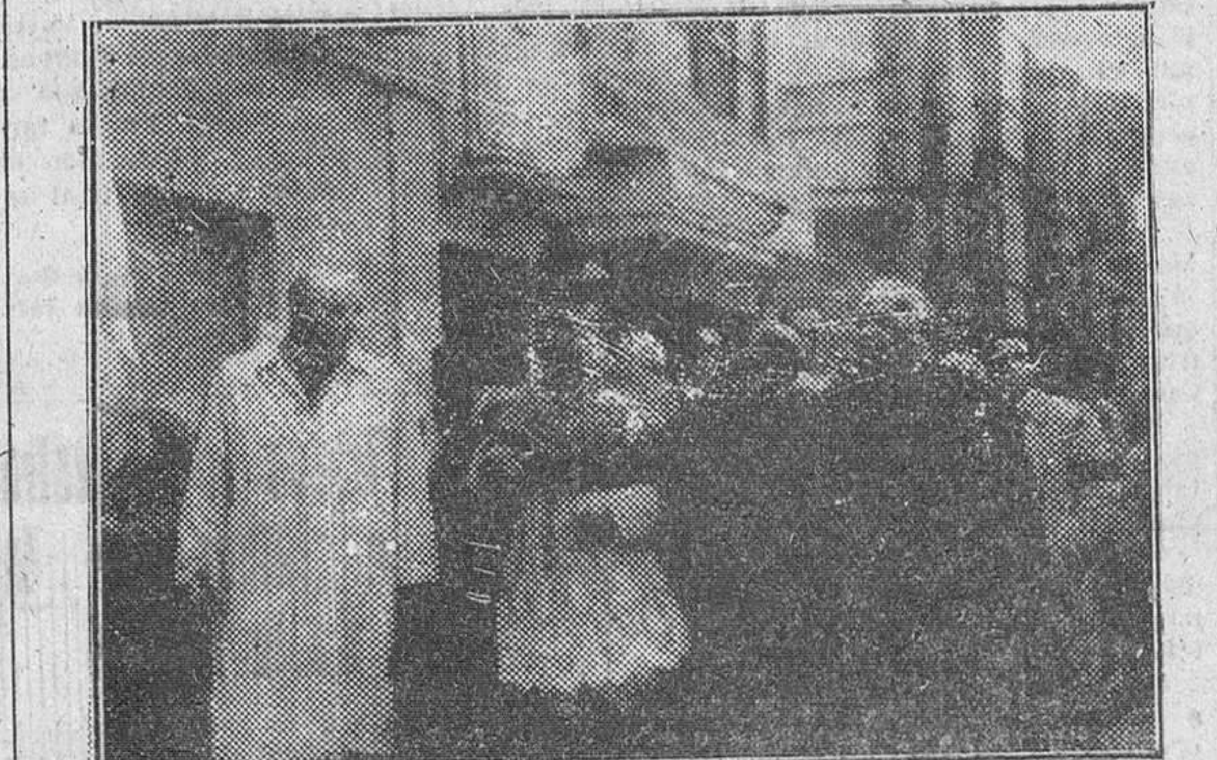
Nuestro Rvdmo., de capa magna y acompañado por su vicario general y por el alcalde de Briviesca, hace su entrada en la capital de la Bureba, donde presidió solemnes actos religiosos allí celebrados el domingo último.