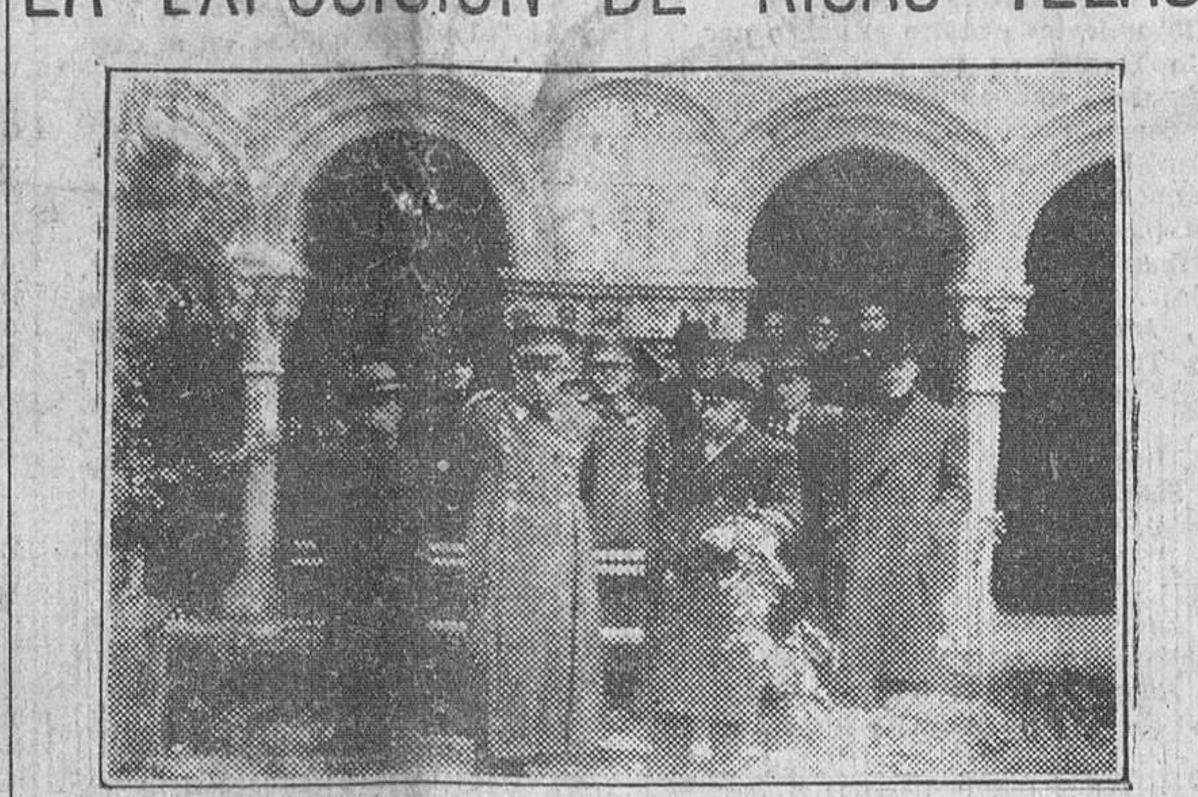
A mediodía de ayer, el capitán general de la Región, acompañado por un grupo de académicos de la Institución "Fernán González" visitó la soberbia exposición de ricas telas instalada en el histórico monasterio de Las Huelgas. A la salida del recinto, los visitantes posaron para nuestro periódico.

EL TENIENTE GENERAL YAGUE VISITA LA EXPOSICION DE RICAS TELAS