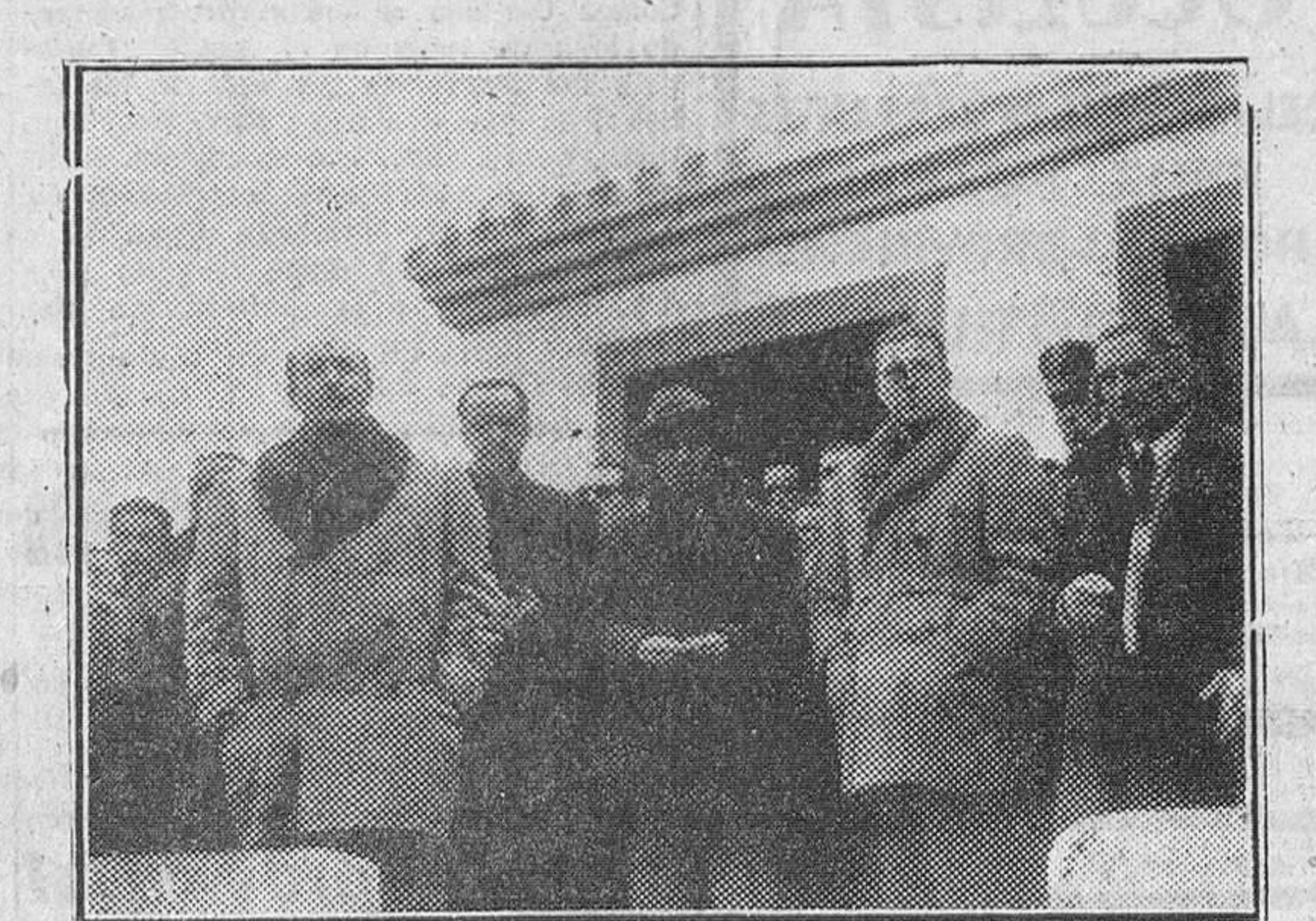
El gobernador civil de la provincia dirigiendo la palabra al vecindario de Treviño en la visita efectuada durante el día de ayer para inaugurar diversas obras e interesarse por los problemas de aquella comarca.

Don Alejandro Rodríguez de Valcárcel, en su doble calidad de gobernador civil y jefe provincial del Movimiento, llevó ayer al burgalesismo Condado de Treviño, el abrazo de la capital de la provincia y de sus autoridades todas, en testimonio del cariño entrañable que une a la Cabeza de Castilla con todos los pueblos de nuestro vasto territorio, aún con aquellos más apartados e incomprendidos. Esos laboriosos pueblecitos —Golernio, Busto, Cuchó, Fuidio, Albaina, Laño, Saraso y Añastro— recibieron ayer, tal vez por primera vez en su historia, la visita del gobernador civil de la provincia, quien tras la inauguración de varias obras realizadas por la Junta Técnica en la cabeza del Condado, dedicó por entero la jornada a recorrer ese preciado rincón de tierra burgalesa y departir con el vecindario de todos aquellos lugares en medio de, entrañable convivencia, para escuchar y estudiar los variados problemas que son, desde hace muchos años, vieja y legítima aspiración de esos pueblos.