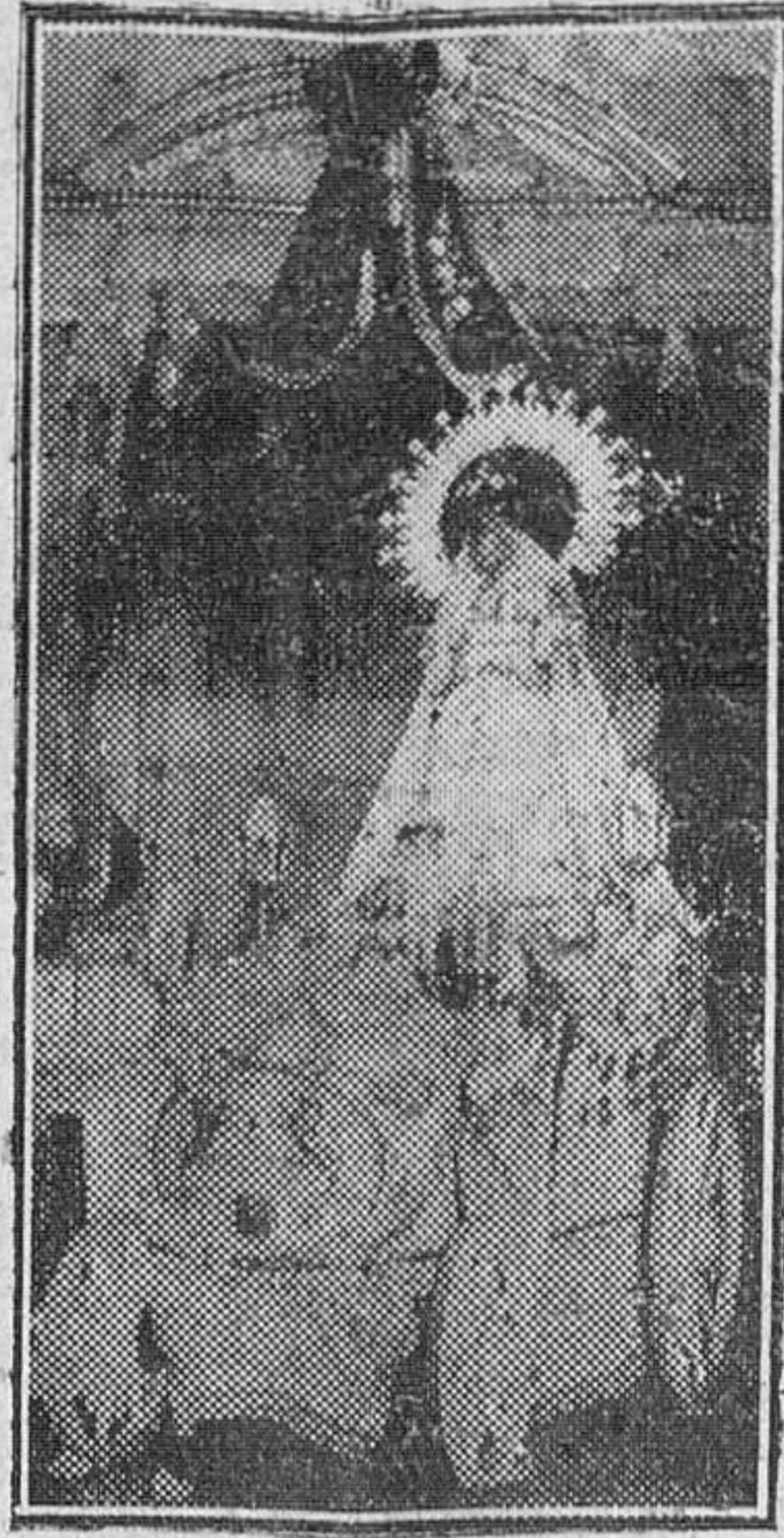
Nuestra Señora la Virgen de las Viñas, Patrona de Aranda de Duero, en su valiosa carroza.