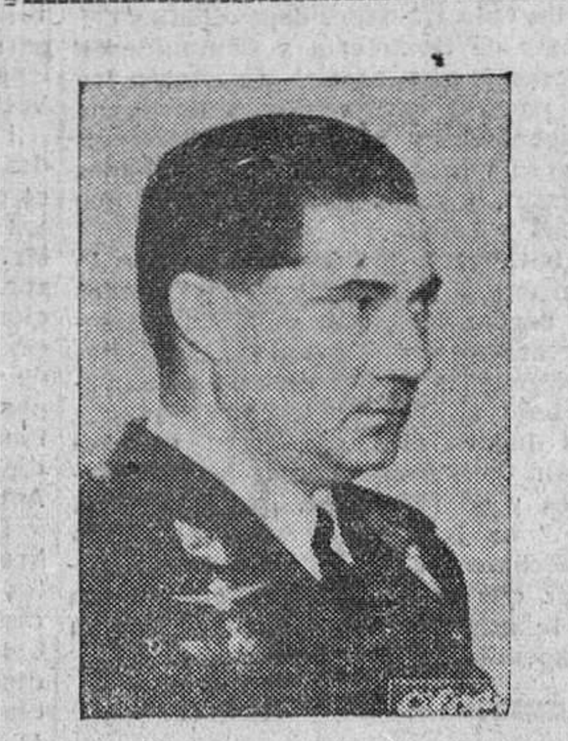
GENERAL GONZÁLEZ GALLARZA

POR SU DECISIVA AYUDA A LA CONSTRUCCION DEL MAGNIFICO AEROPUERTO DE SONDICA