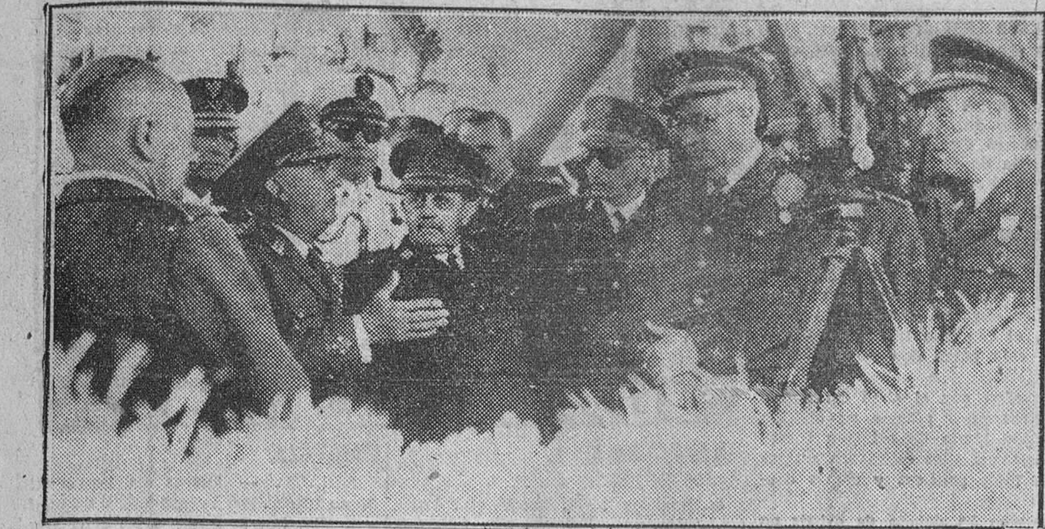
San Sebastián.—Su Excelencia el Jefe del Estado, con los altos jefes del Ejército español, durante el ejercicio táctico desarrollado en las Peñas de Ayas.

PALABRAS DEL CAUDILLO ANTE LOS ALCALDES DE GUIPUZCOA QUE FUERON RECIBIDOS AYER POR S. E. EN EL PALACIO DE AYETE