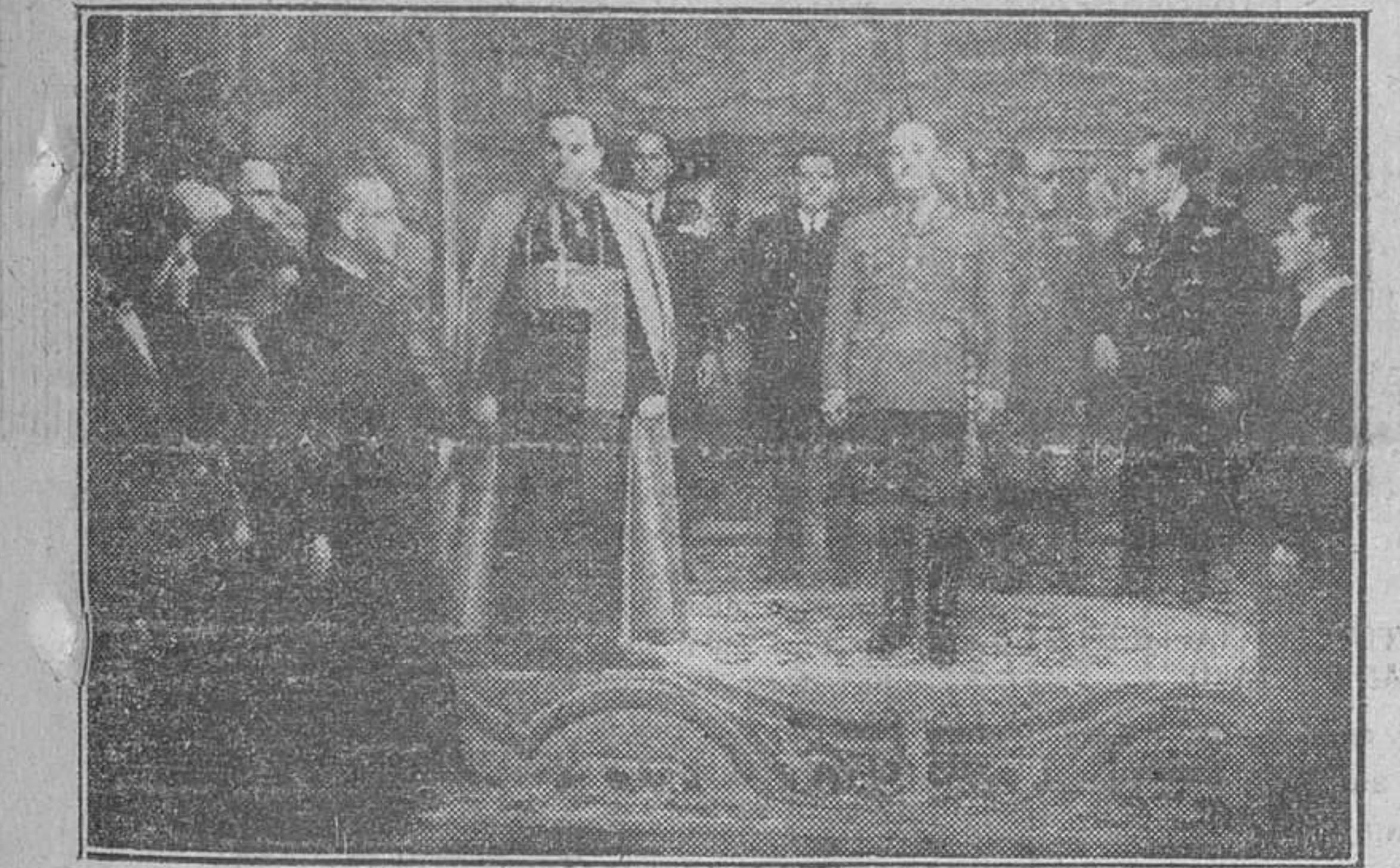
Madrid.—S. E. el Jefe del Estado fué cumplimentado por Monseñor Serafini, obispo de Mercedes (Argentina), que preside la peregrinación de argentinos y uruguayos "Crucero de San José de Calasanz.—Foto Cifra