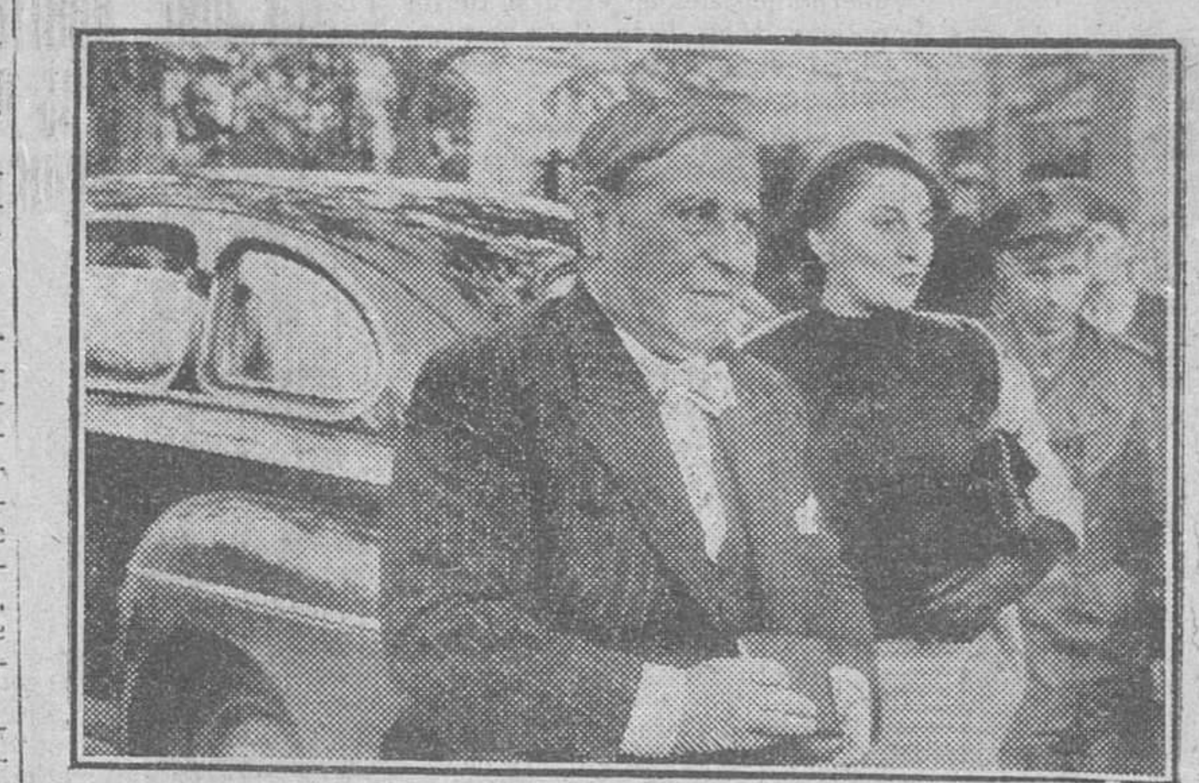
Madrid.— El genial escritor acompañado de su esposa a su llegada a esta capital, donde recibió la bienvenida de numerosos amigos y admiradores.