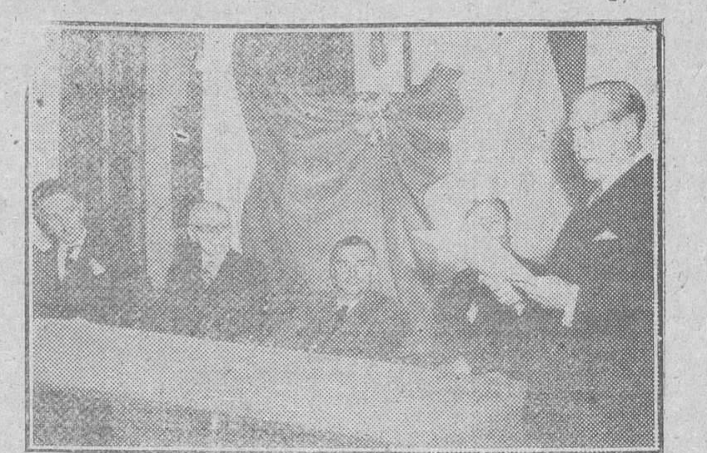
Quito. -- El vicepresidente de la República ecuatoriana, el director del Instituto hispanico y otras altas personalidades durante el acto inaugural de la Biblioteca hispanica de esta ciudad.