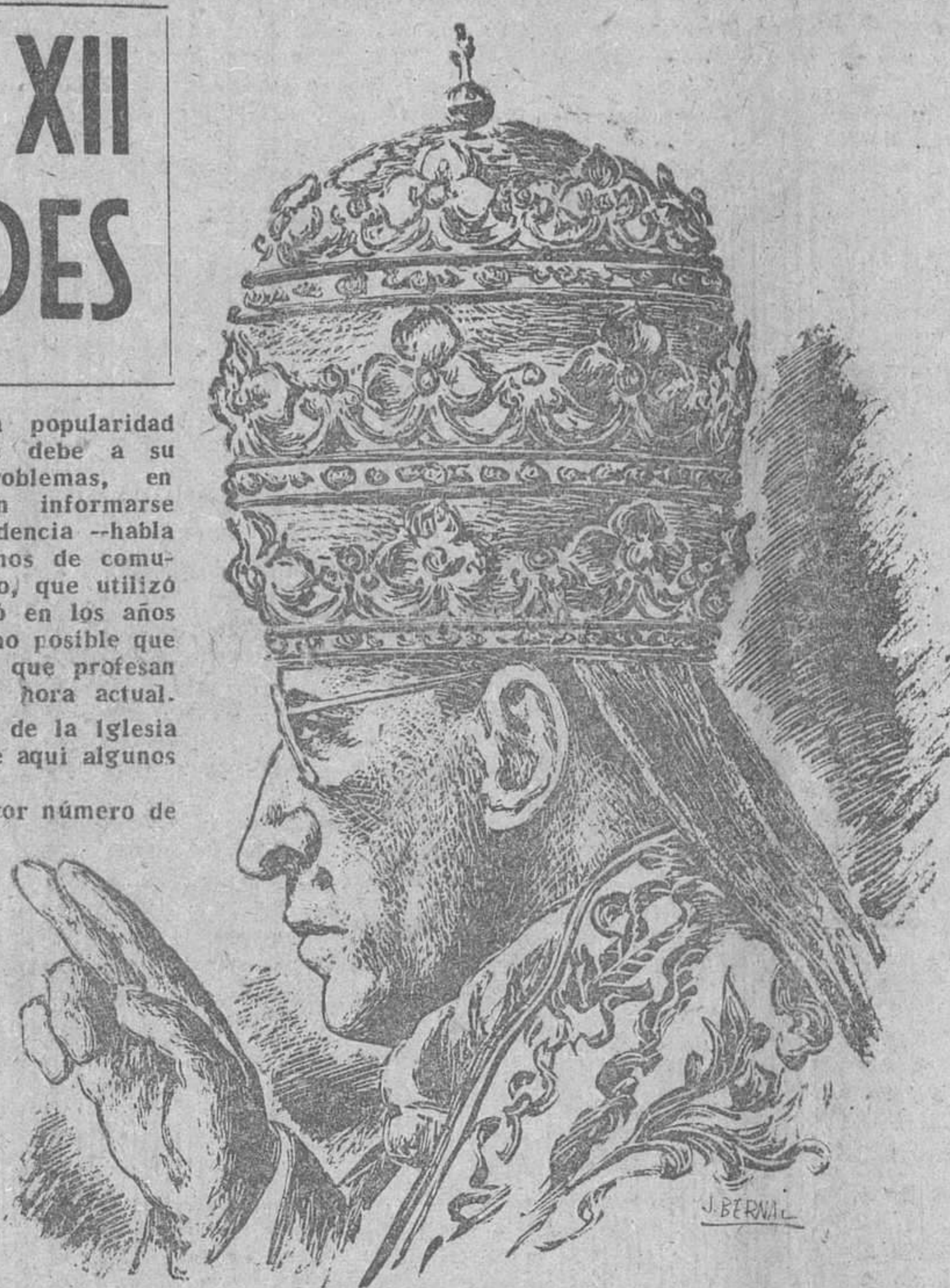
(Pasa a cuarta página)

Si, como alguien ha dicho, jamás hubo un Papa que gozase de tan amplia popularidad como el actual Pontífice, Su Santidad Pio XII, en gran parte ello se debe a su extraordinario interés en conocer de primera mano todos los problemas, en hablar con el mayor número posible de personas de todas las clases sociales, en informarse de cuanto ocurre en el mundo entero. El don de lenguas que le dió la Providencia —habla correctamente Su Santidad siete idiomas, como es sabido—; los medios modernos de comunicación y de propaganda, el aeroplano, el cinematógrafo, la radio y el teléfono, que utilizó siempre; su profundo conocimiento de distantes y muy diversos países que visitó en los años que precedieron a su elevación al Trono de San Pedro... Todo ello unido ha hecho posible que sea Su Santidad, no ya entre los católicos, sino incluso entre amplios sectores que profesan distintas religiones, una de las personalidades más queridas y respetadas de la hora actual.