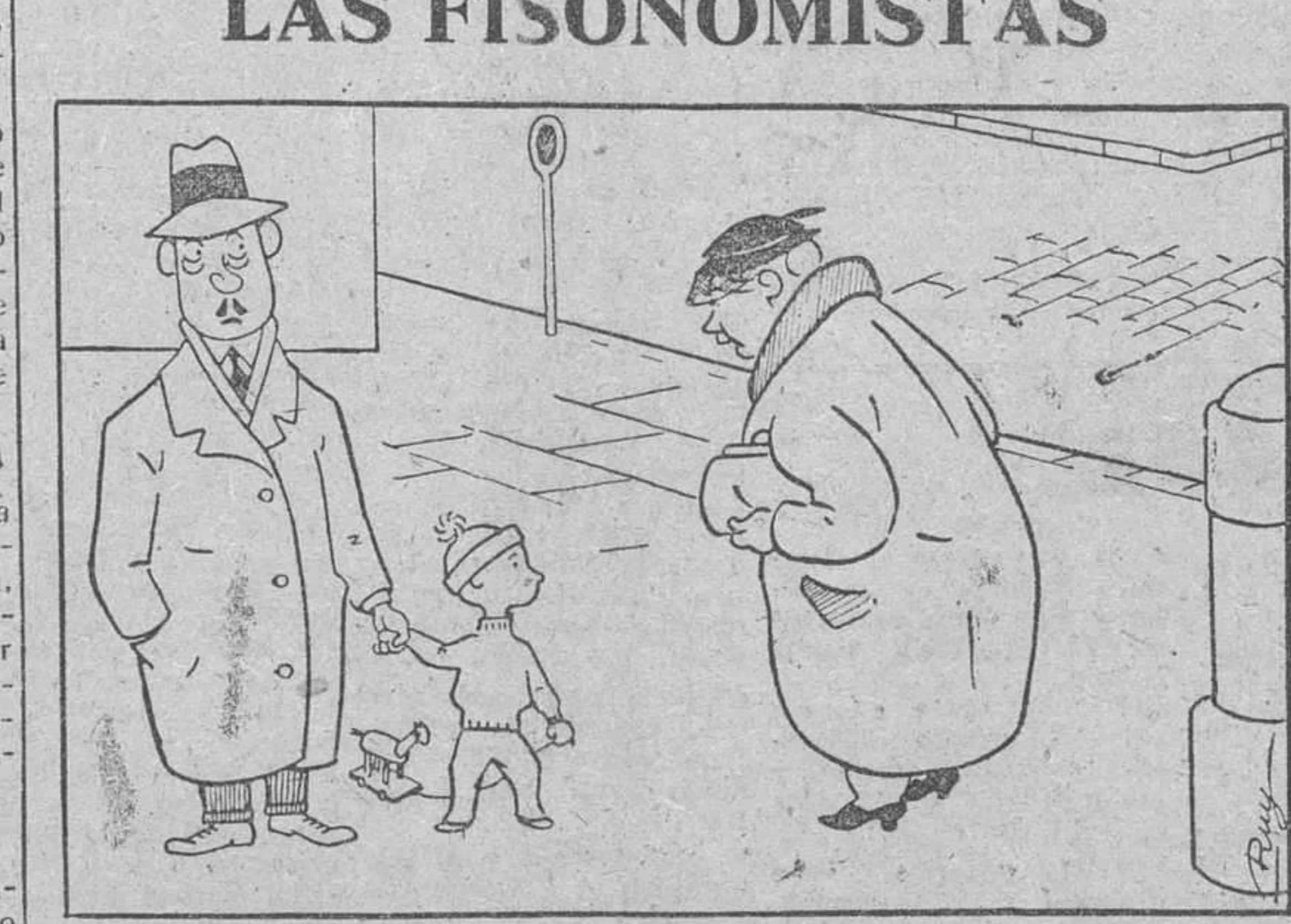
—¿Qué pequeño tan precioso. No puede negar que es suyo. Tiene toda la cara de Vd. —Es que... como no tenemos hijos... Mi esposa se empeñó en que lo acogiéramos ¿sabe? Ha venido a España con una expedición de niños austriacos...

El texto del pacto, que no ha sufrido modificaciones, fue hecho público algún tiempo atrás.—Efe.