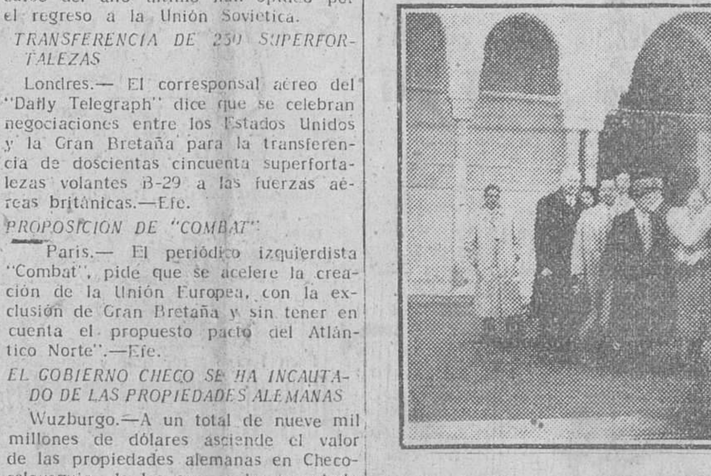
GRANADA.—DIHOS REPRESENTANTES DURANTE SU VISITA A LA ALHAMBRA.—(Foto Cifra)