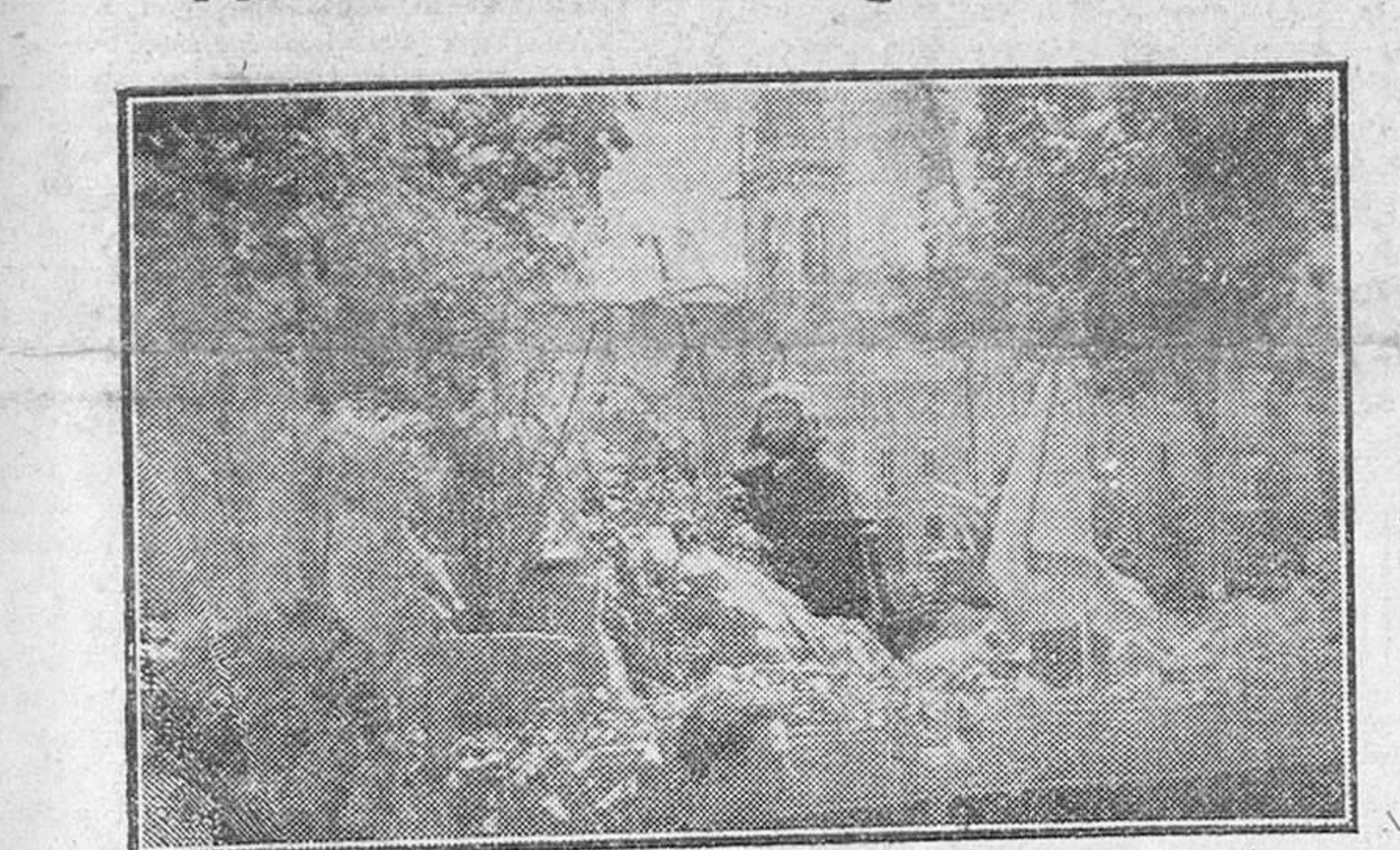
EL DOMINGO RECORRIÓ LAS CALLES LA CIUDAD UNA VISTOSA CARROZA, COMO PROPAGANDA ANTE LA PROXIMA PEREGRINACION DE LA JUVENTUD ESPAÑOLA DE ACCION CATOLICA A SANTIAGO DE COMPOSTELA. EN NUESTRO GRABADO, DESFILABA EL CORTEJO POR LA AVENIDA DEL GENERALISIMO