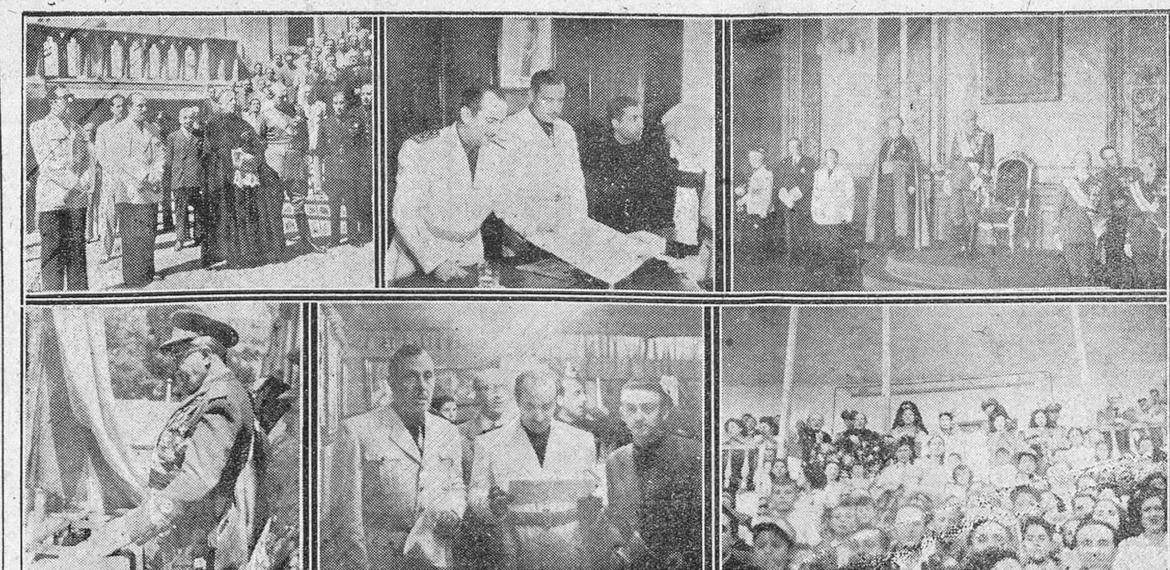
Reportaje gráfico de las fiestas celebradas el domingo, con motivo del XII aniversario del glorioso Movimiento nacional y de la fiesta de la “Exaltación del trabajo”. Arriba, de izquierda a derecha, la ofrenda a los caídos, el jefe provincial del Movimiento entregando los premios a productores modelo y un detalle de la recepción de Capitanía general. Abajo, el teniente general Yagüe presidiendo el desfile de las tropas, la inauguración de la VIII exposición de arte de Educación y Descanso y el acto presidencial durante la celebración del festival taurino.