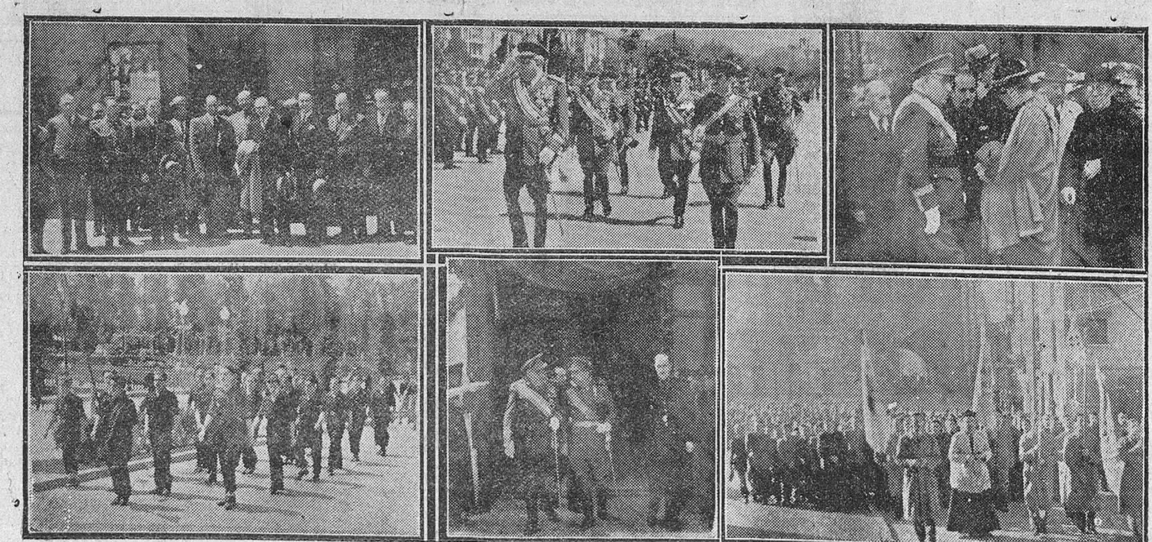
Arriba, de izquierda a derecha: Los notarios y registradores de la propiedad, de nuestra ciudad, acompañados de las autoridades que asistieron a la misa celebrada en la mañana del domingo en la iglesia del Carmen, en honor de San Juan Evangelista. Patrono de aquellos; el teniente general Yagüe pasando revista a los caballeros cadetes de la Academia de Ingenieros en la calle de la Merced antes de asistir a la misa con que se conmemoró la festividad de San Fernando; las autoridades burgalesas fotografiadas a la entrada de la Iglesia de la Merced. Abajo, también de izquierda a derecha: Las centurias del Frente de Juventudes desfilando por el paseo de la Isla, donde tuvieron lugar brillantes actos en conmemoración de la del edificio del Teatro. Por último, impresionante aspecto que ofrecía la calle de Cadena y Eleta, en la madrugada de ayer (último día del mes de Mayo, dedicado a María), el regreso al S. T. M. del solemne Rosario de la Aurora que recorrió varias calles de la ciudad.