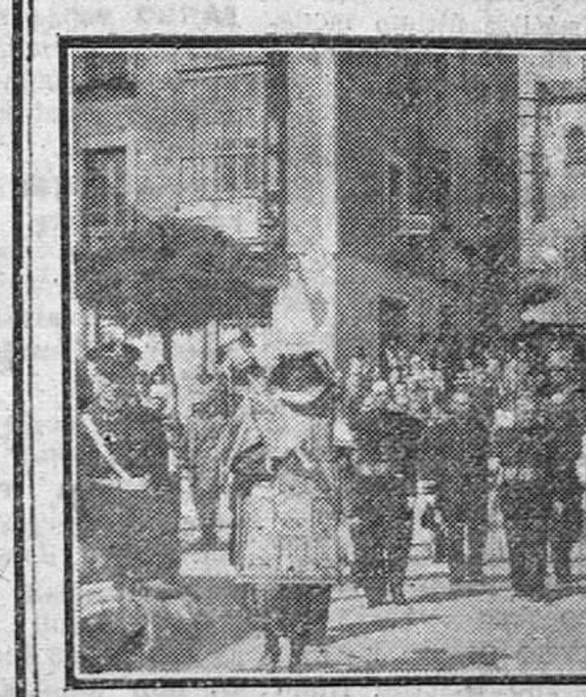
El domingo se celebró, con la tradicional solemnidad, la festividad de la Exaltación de la Santa Cruz. Nuestras fotografías muestran, a la izquierda, al Excmo. Ayuntamiento, en Corporación, saliendo del S. T. M. y a la derecha, un momento de la bendición del crucero conmemorativo del Milenario de Castilla.