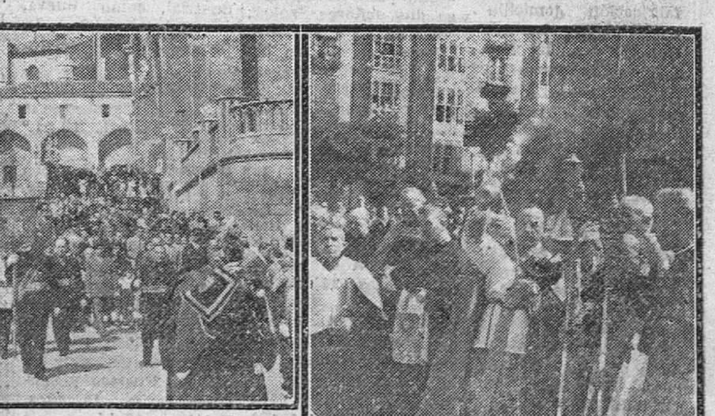
El domingo se celebró, con la tradicional solemnidad, la festividad de la Exaltación de la Santa Cruz. Nuestras fotografías muestran, a la izquierda, al Excmo. Ayuntamiento, en Corporación, saliendo del S. T. M. y a la derecha, un momento de la bendición del crucero conmemorativo del Milenario de Castilla.