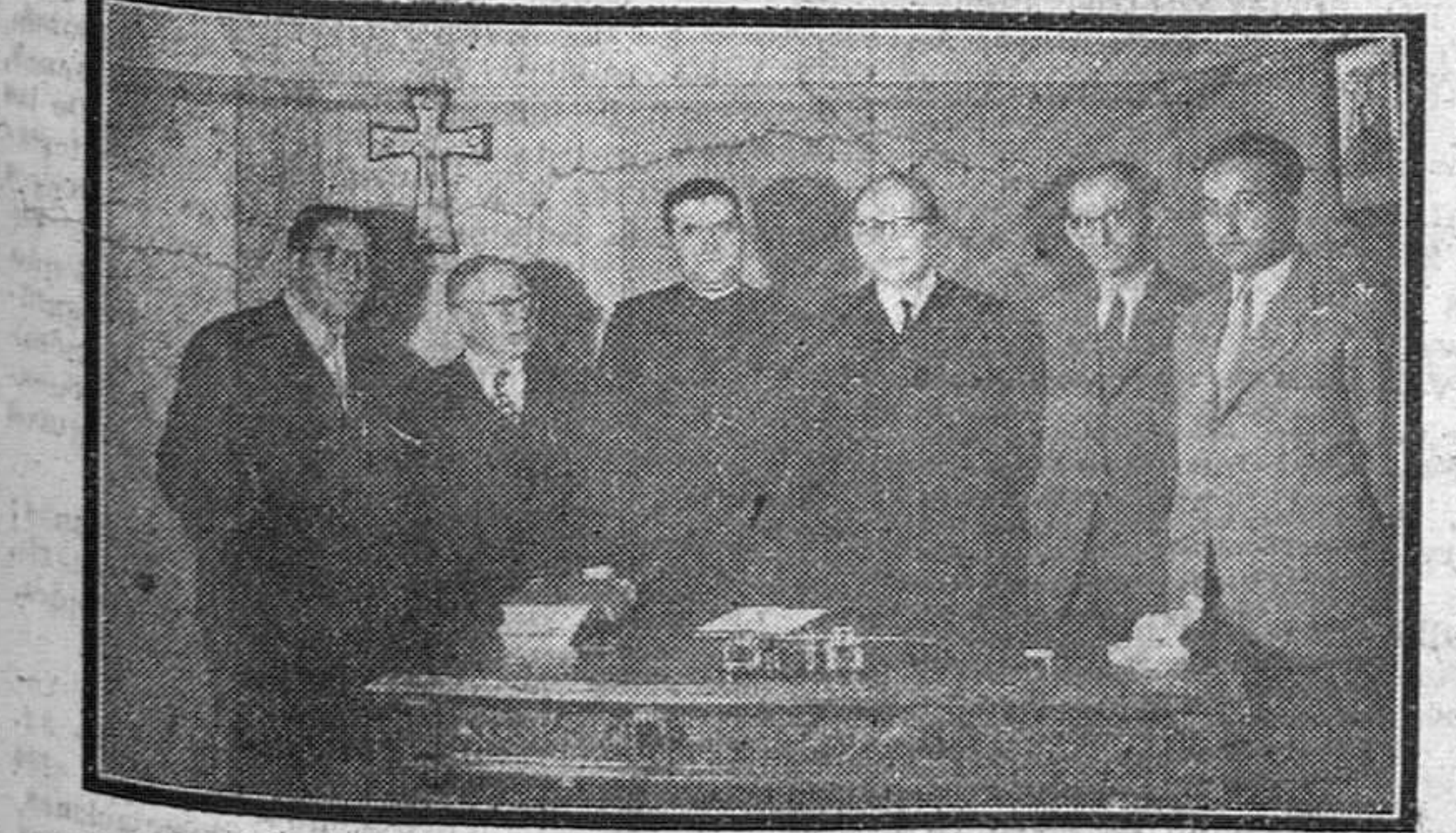
El ministro de Educación Nacional, señor Ibáñez Martín, momentos después de comunicar a los directores de los periódicos locales, en la Delegación de Educación Popular, la ampliación a la referencia del Consejo de ministros celebrado el martes último en Burgos.