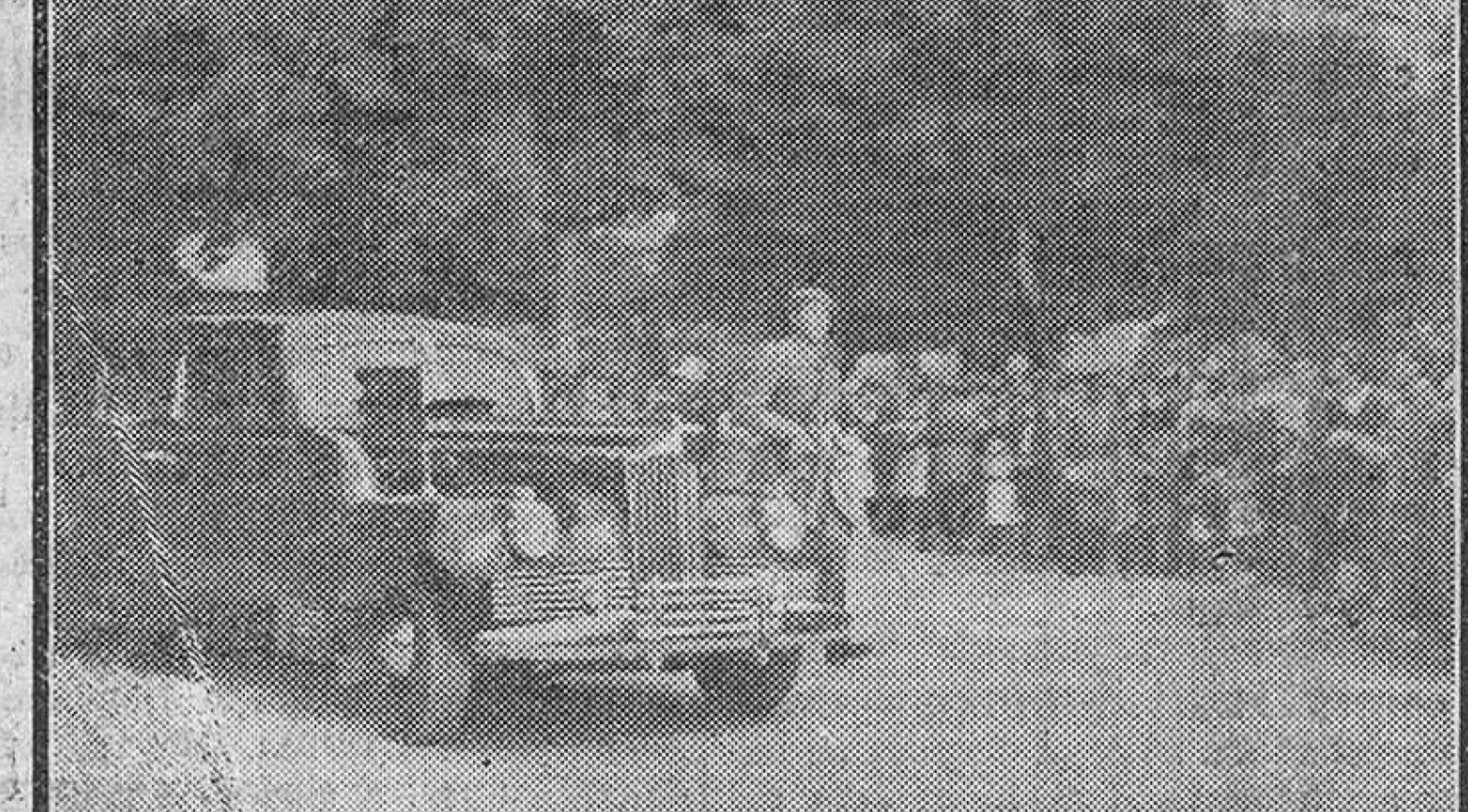
Arriba, Su Excelencia el jefe del Estado conversa afectuosa. mente con nuestro Rvdmo. Prelado, momentos antes de abandonar Burgos. Abajo, el coche del Caudillo saliendo del palacio de la Isla.