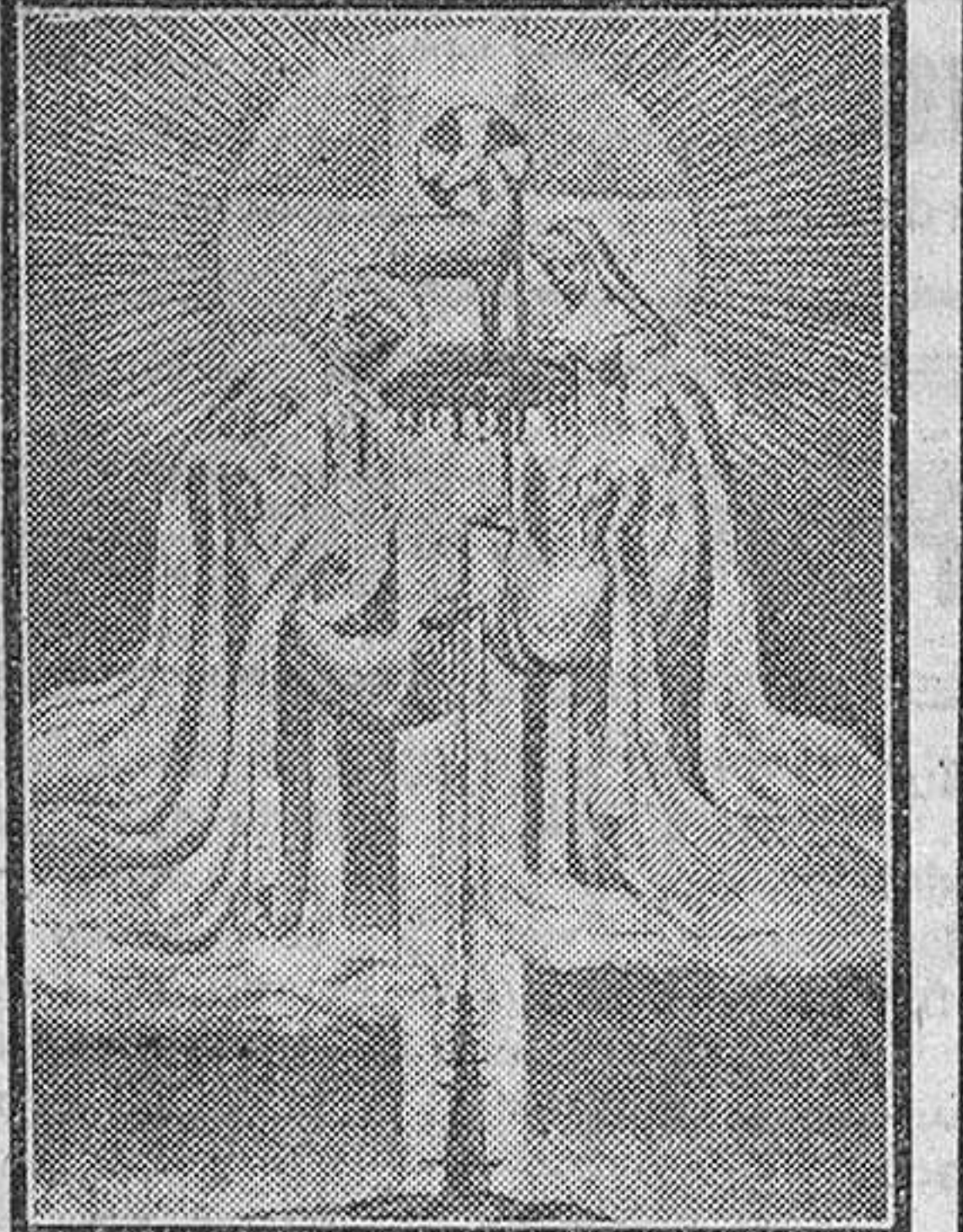
El día 24 de Noviembre pasado, nuestro Santo Padre el Papa, en solemne y emotiva ceremonia, circundado de la corona de treinta arzobispos y Obispos, ceñía con el lauro de la Beatificación las sienes de 29 mártires, hijos del seno prolifico de la Orden Franciscana. Un día de jubilo intenso y alborozado para la gran Madre la Santa Iglesia y día también de gloria rutilante y magnífica para la otra Madre, el Orden Franciscano, que veía erigirse su cielo con el sideral de 29 nombres, astros en el cielo y amapolas en la tierra.

CONDOLENCIA DEL AYUNTAMIENTO DE LISBOA Lisboa. — El Ayuntamiento de Lisboa ha expresado su condolencia por la catástrofe de Cádiz. Propuso su presidente se enviara un telegrama de pésame al alcalde de Cádiz expresando el hondo pesar de la ciudad de Lisboa. —Efe.