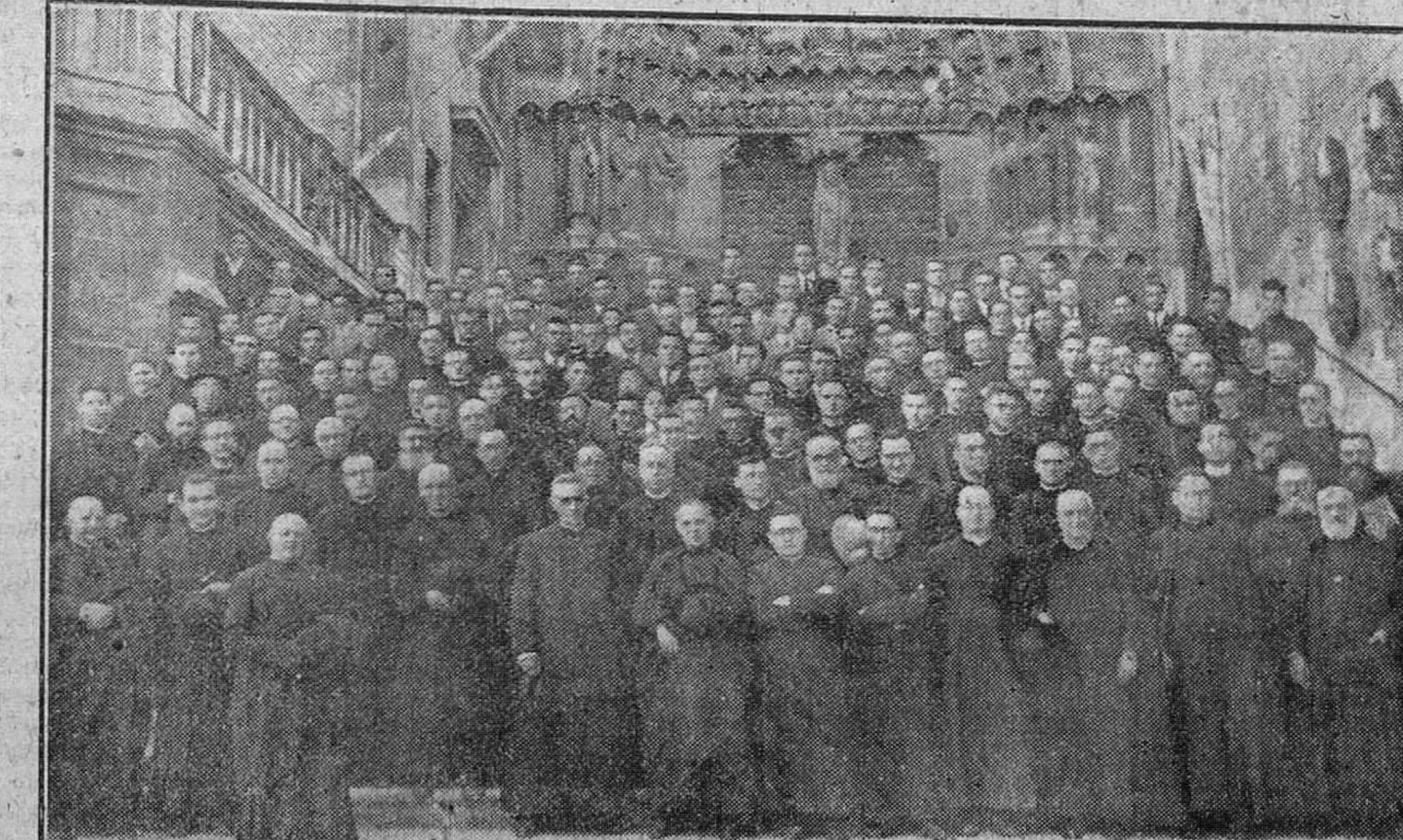
Los seminaristas hispanoamericanos y españoles, que asisten al cursillo de Misionología de Burgos, posan para nuestro fotógrafo en la escalinata del Sarmantal, de la Catedral.