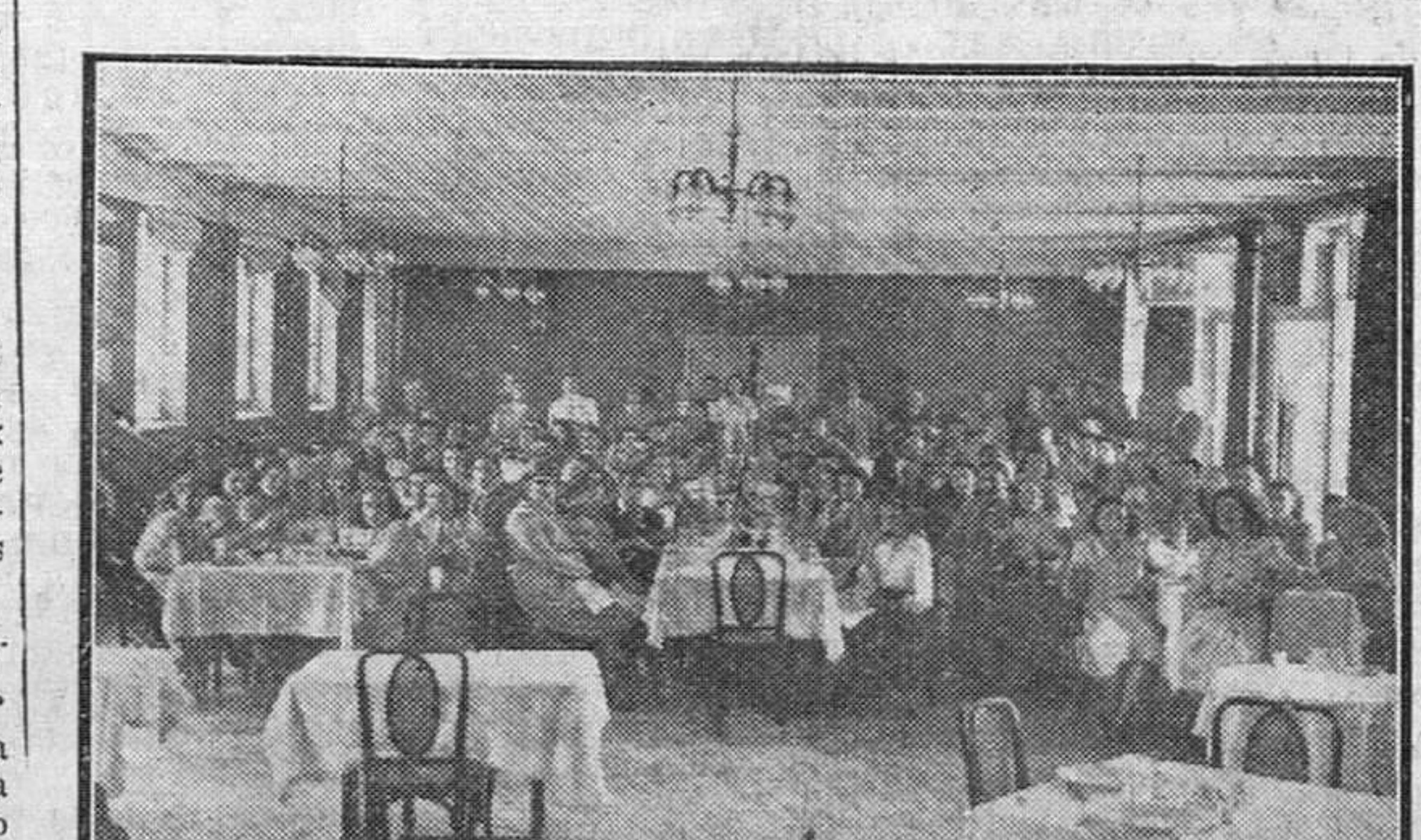
Empresarios, técnicos y una nutrida representación de obreros de la empresa "Reido S. A." en la fraternal comida de hermandad en el Restaurante de Auto Estaciones con motivo de haberse convalidado aquella el título de "empresa modelo".