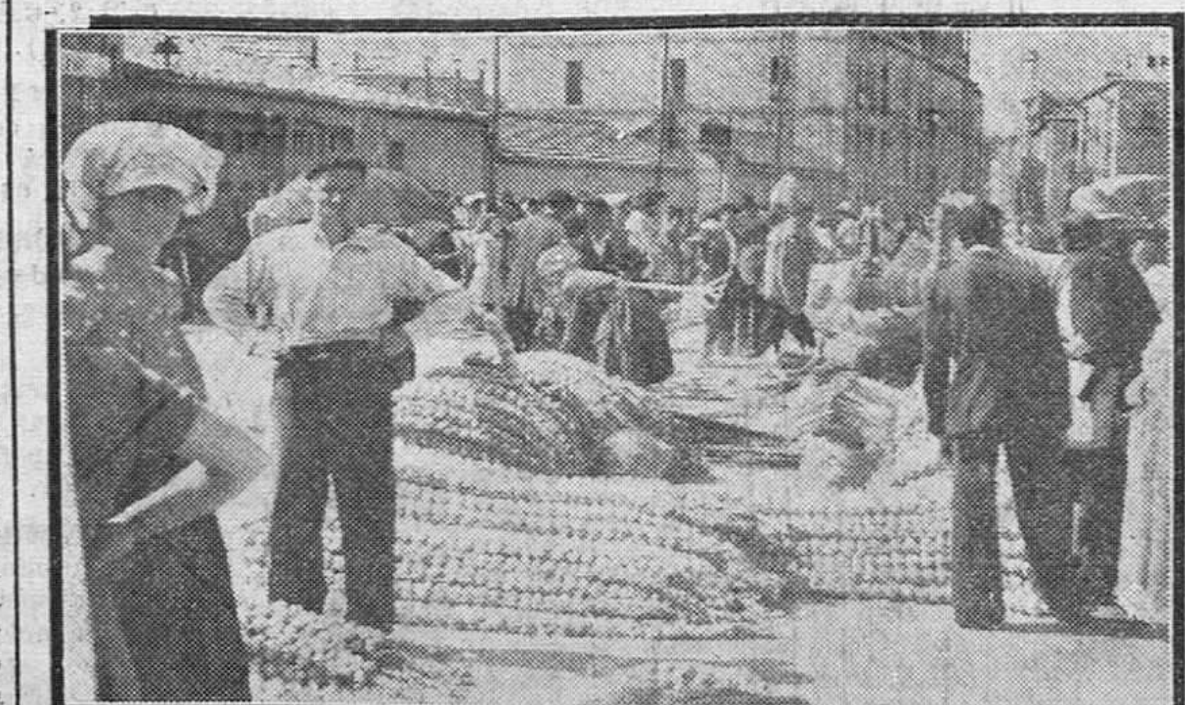
Una vista del típico mercado de ajos y aperos de labranza que se celebra anualmente en nuestra ciudad con motivo de la festividad de Santiago Apóstol.