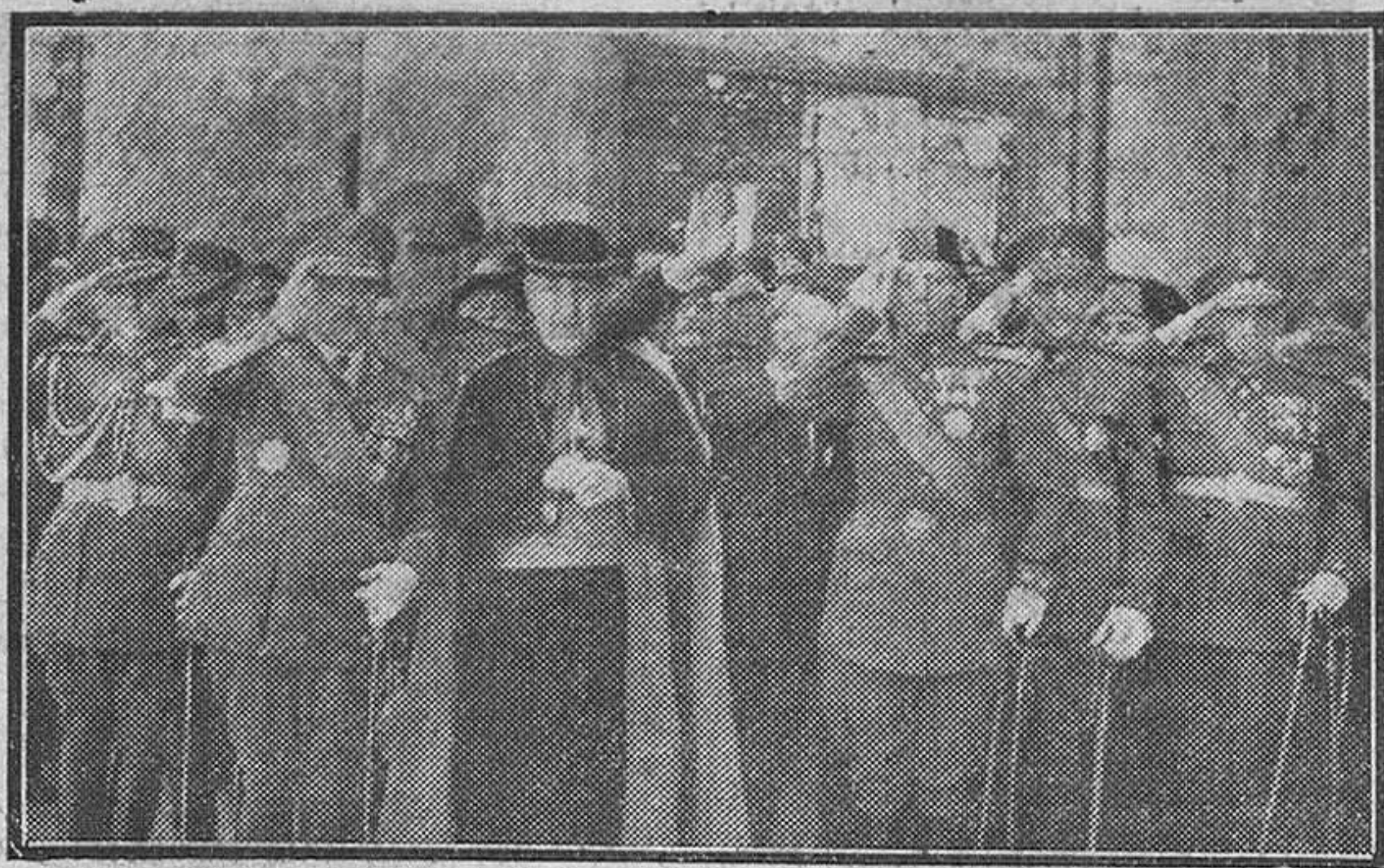
Las autoridades a la salida de la Iglesia de la Merced después de asistir a la misa celebrada por el Arzobispo de Compostela en honor del patrón de España, Santiago.