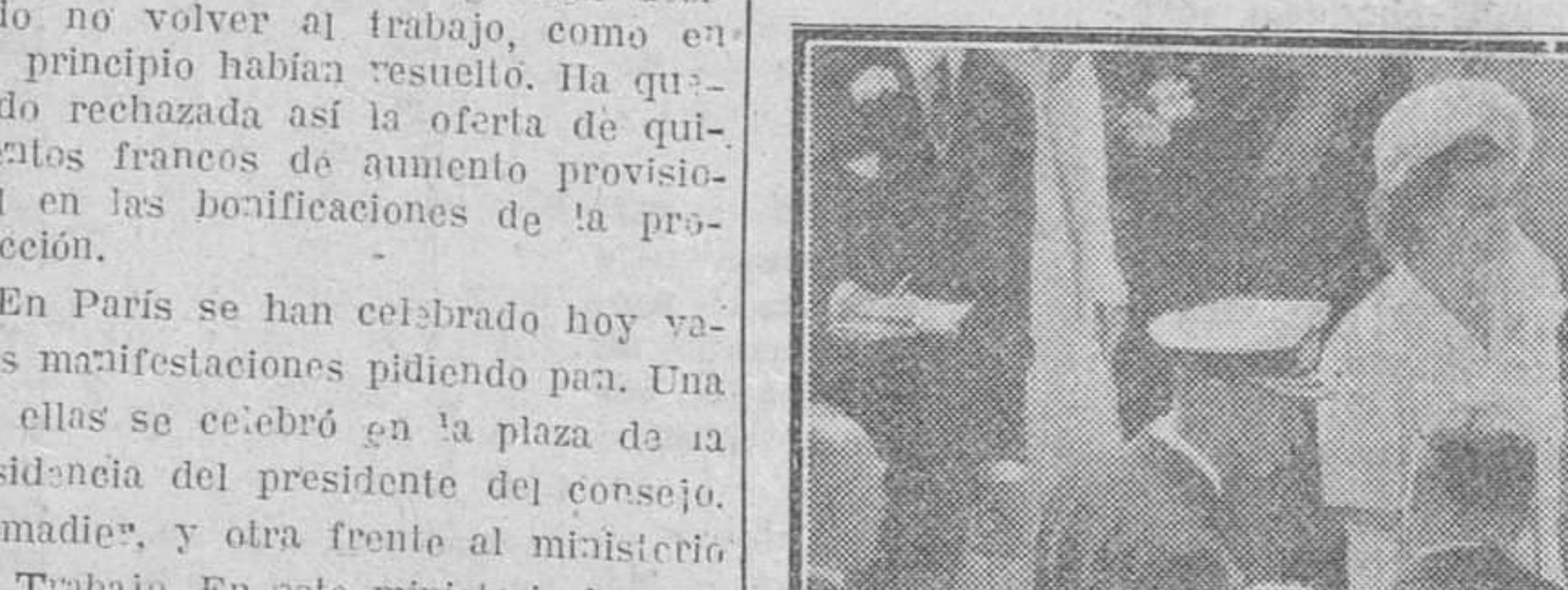
Londres. El Rey de Inglaterra y la princesa heredera Isabel, saludan a sus invitados durante el "garden party" celebrado en los jardines del palacio de Buckingham.