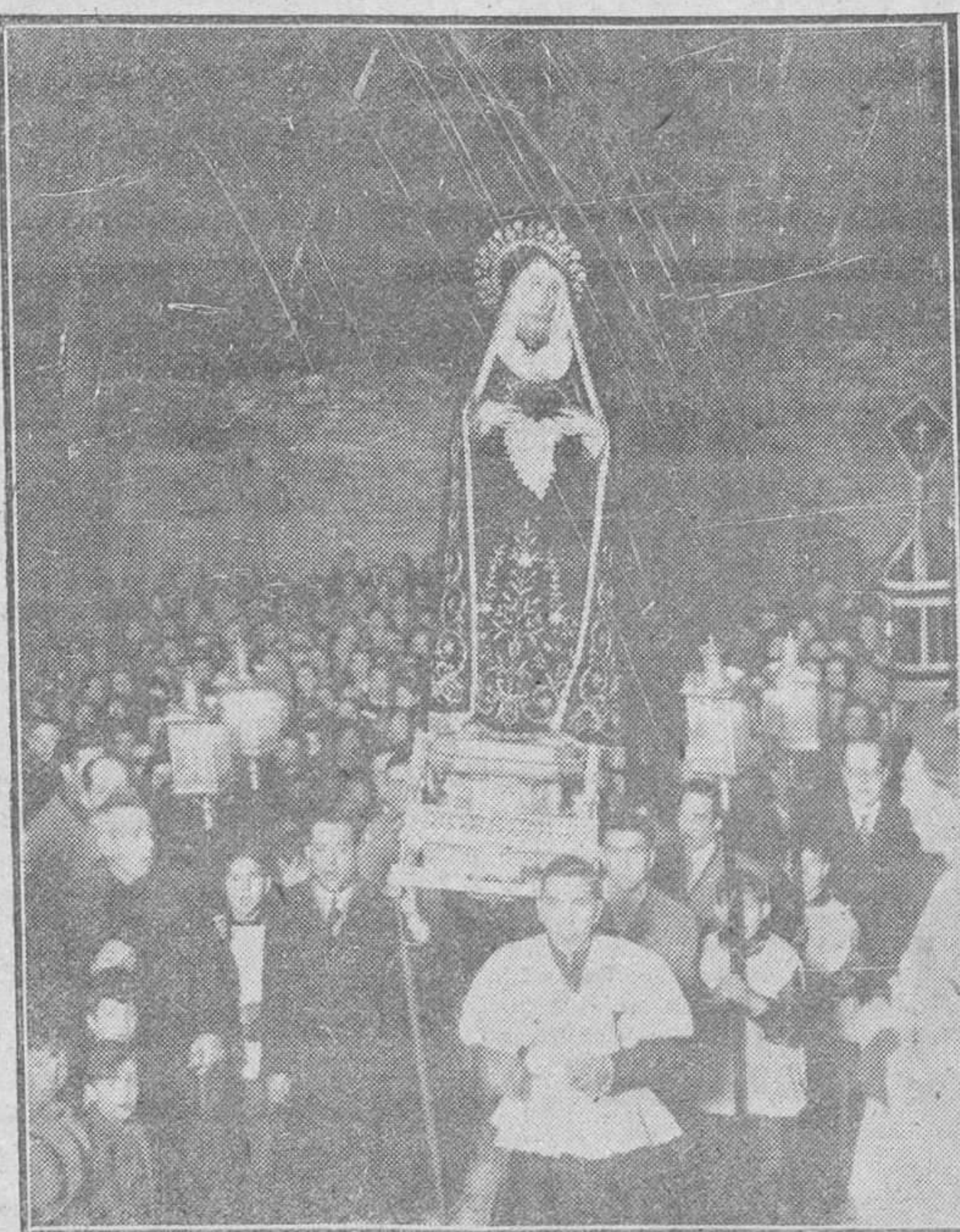
Imagen de Nuestra Señora de la Soledad, que ayer fue trasladada procesionalmente a nuestro templo Catedralicio. La fotografía recoge el momento de la llegada de la venerada imagen ante la prisión provincial, donde los reclusos entonaron la "Salve Popular".