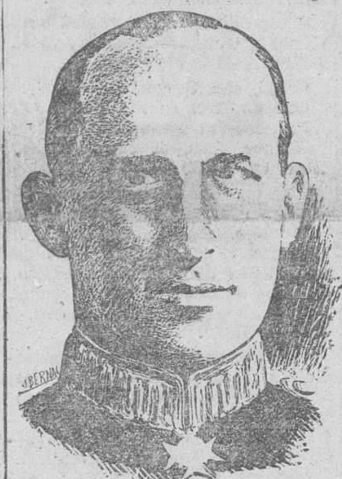
EL REY JORGE

Le sucede como soberano de los helenos el Príncipe Pablo