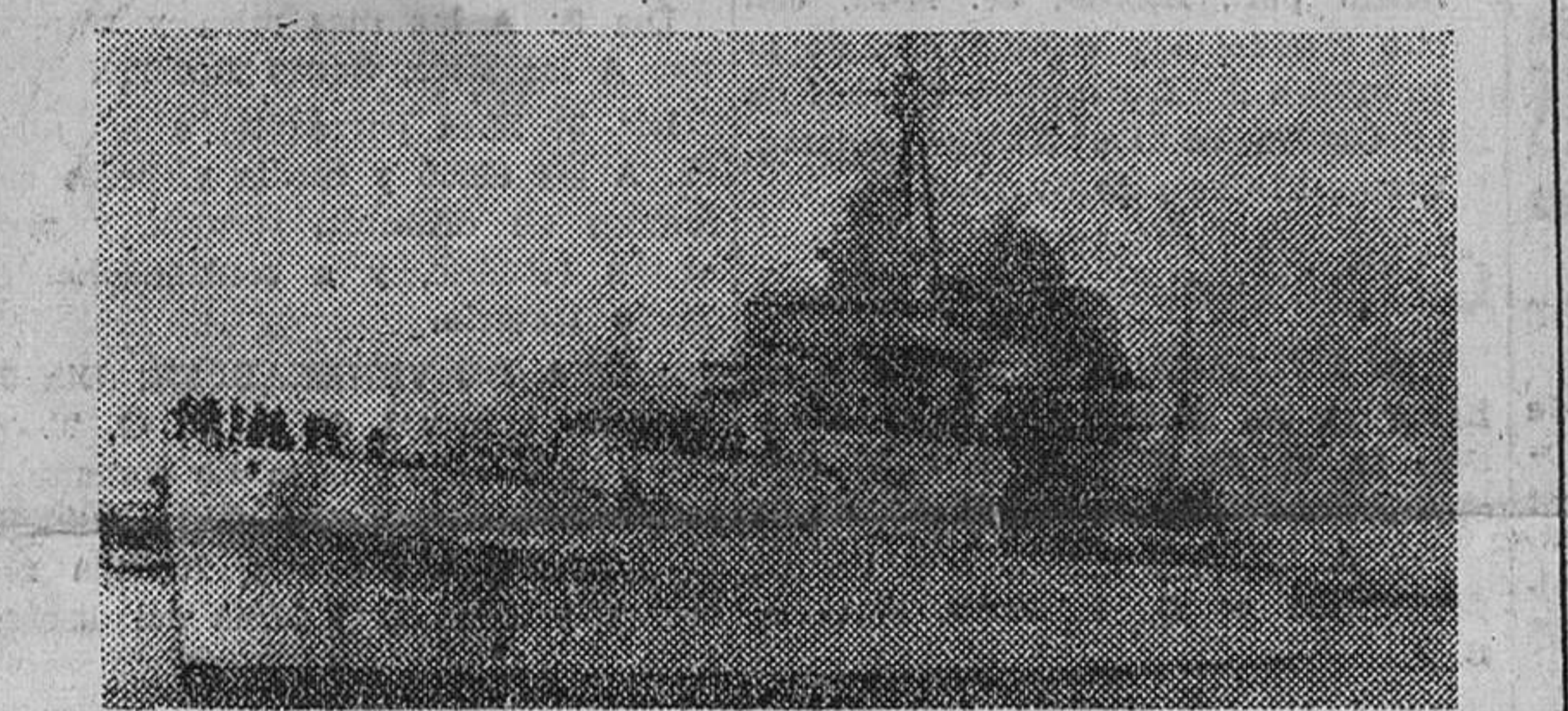
Cádiz. -- El buque-escuela "Argentina" entrando en la bahía del puerto de esta ciudad.