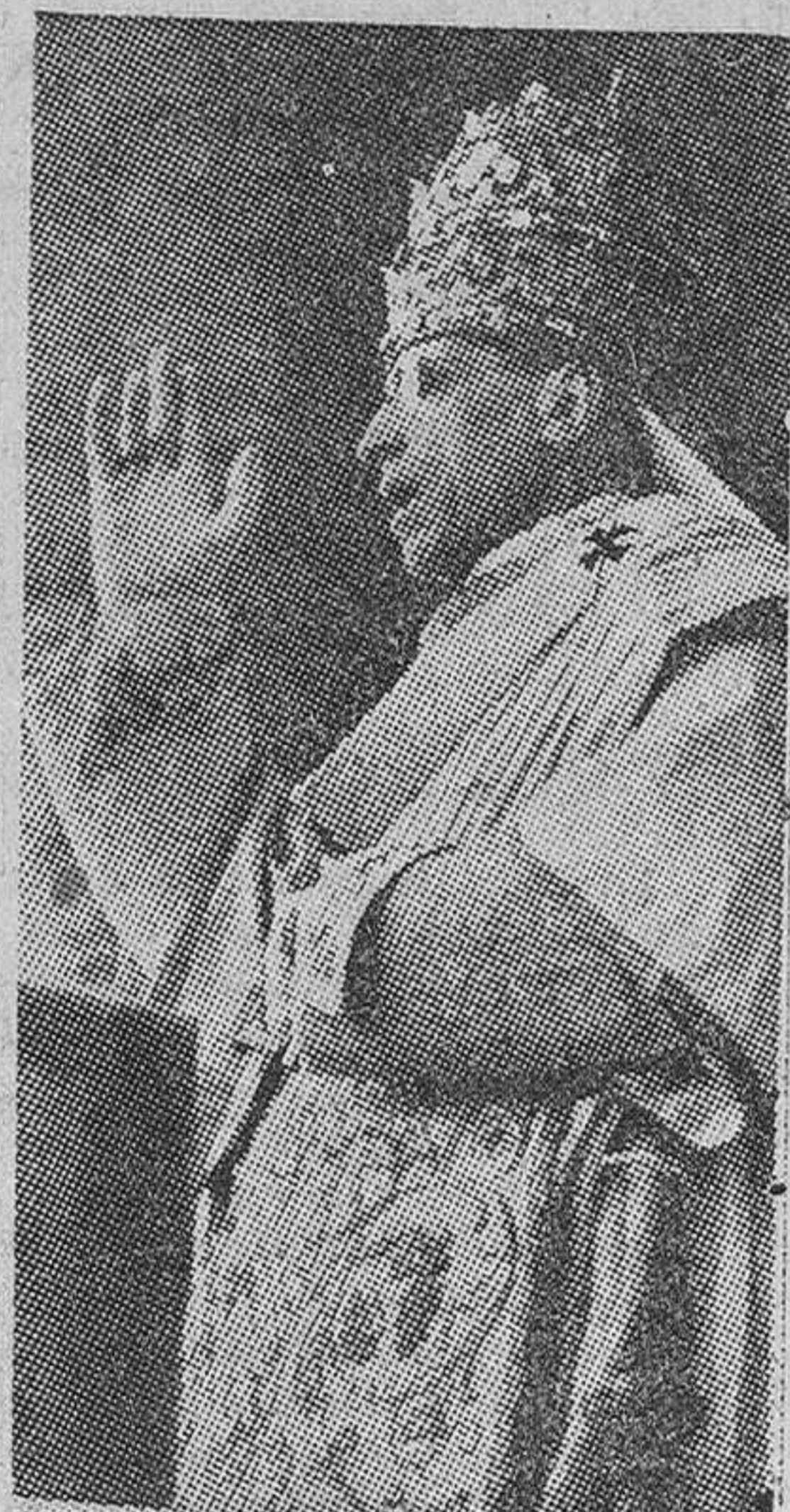
mente realizada con su muerte. En un sentido, no hizo más que comenzar. Ha dado remate perfectamente a la labor asignada a El por el Padre, en lo que respecta a su cuerpo mortal. Y por ello El dio a sus discípulos que iba a edificar una Iglesia y

"Es posible -dice Su Santidad- que el mayor pecado en el Mundo, hoy día, sea el de que los hombres han empezado a perder el sentido del pecado. Este sentido no puede ser arrancado del corazón humano; q- este sentir se despierte con la idea de que el Dios Hombre muriendo en la Cruz del Gólgota, pagó la penalidad del pecado. "La labor de Cristo no quedó total-