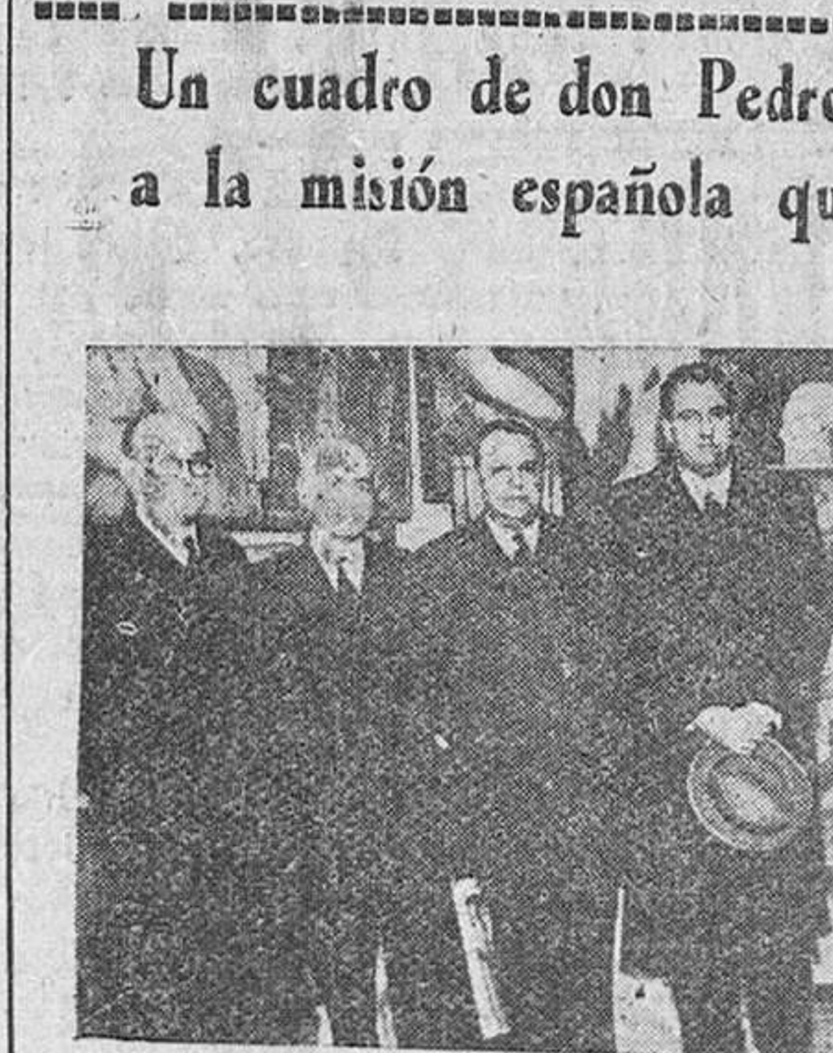
Los ministros de Asuntos Exteriores y Educación Nacional, con el ministro de El Salvador en España y otras personalidades, en el estudio del pintor Vázquez Díaz, donde ha sido entregada la misión española que marcha a las fiestas del Centenario del descubrimiento de El Salvador, un cuadro de D. Pedro de Alvarado.

Asamblea General de las Naciones Unidas, el delegado venezolano el Sr. Stok abordó el "caso español", calificándolo de factor que perturba el funcionamiento de las Naciones Unidas y (Continúa en última página)