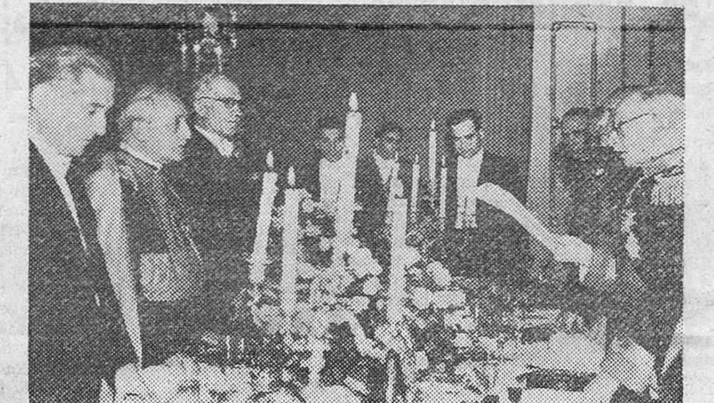
En Lisboa se celebró una recepción en honor del Legado Pontificio para la coronación de la Virgen de Fátima. Cardenal Masella, en cuyo acto el general Carmona leyó un discurso de salutación con emocionadas palabras para el culto Mariano de la Virgen de Fátima