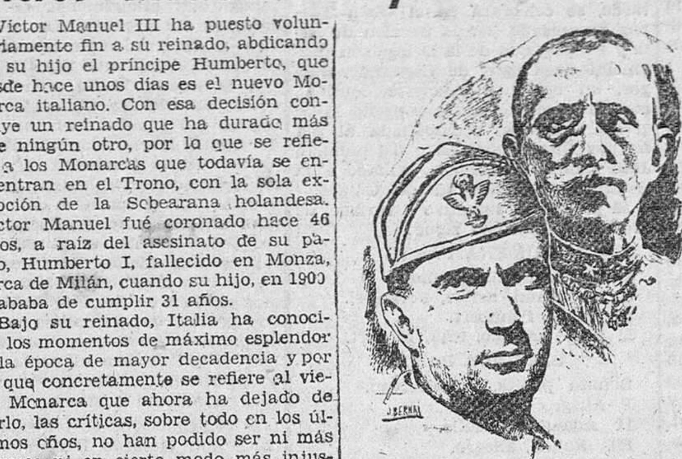
Inteligente y muy político, Víctor Manuel quiso evitar de esta forma que su permanencia en el Poder pudiese dar lugar a un cambio de régimen.