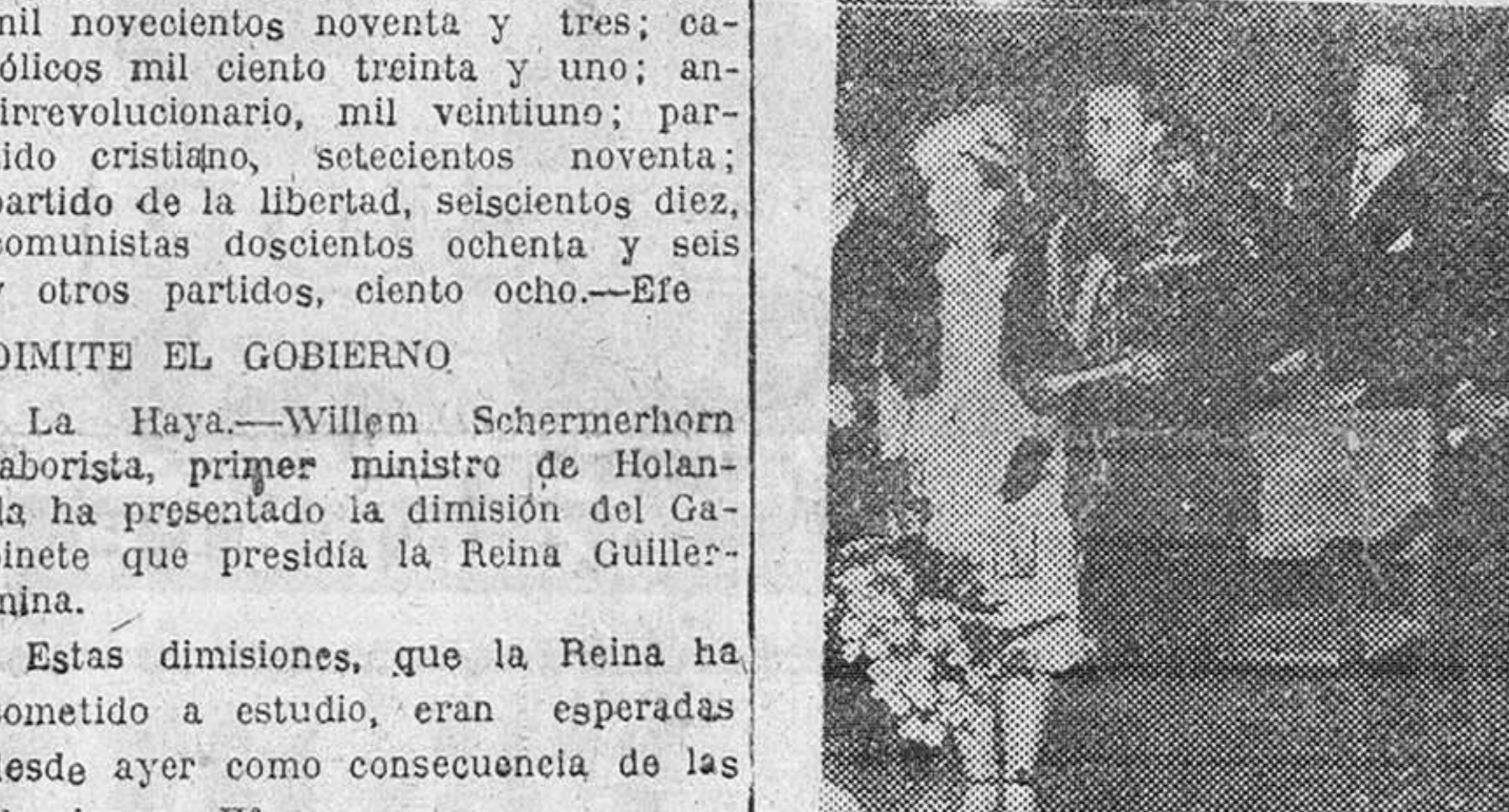
El ex-primer ministro británico, Winston Churchill, ha sido nombrado doctor Honoris causa de la Universidad de Leiden. De izquierda a derecha: la princesa Juliana, el príncipe Bernardo, la señora de Churchill, Winston Churchill y Mary Churchill, durante la ceremonia.