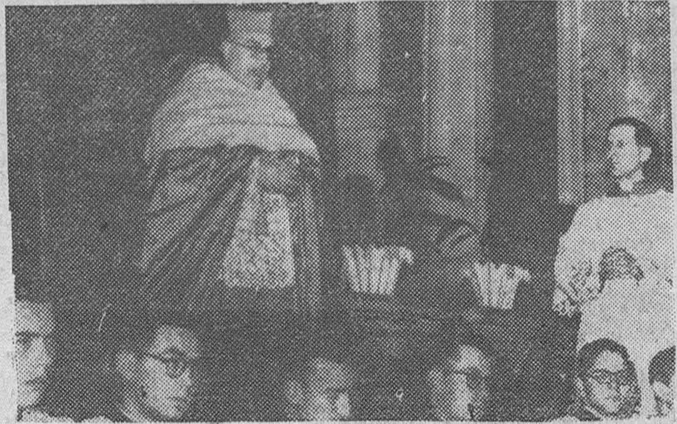
El Cardenal Primado de España, Arzobispo Dr. Pla y Deniel, toma posesión de la Iglesia de San Pedro y Montorio de Roma, simbólica diócesis de su cardenalato