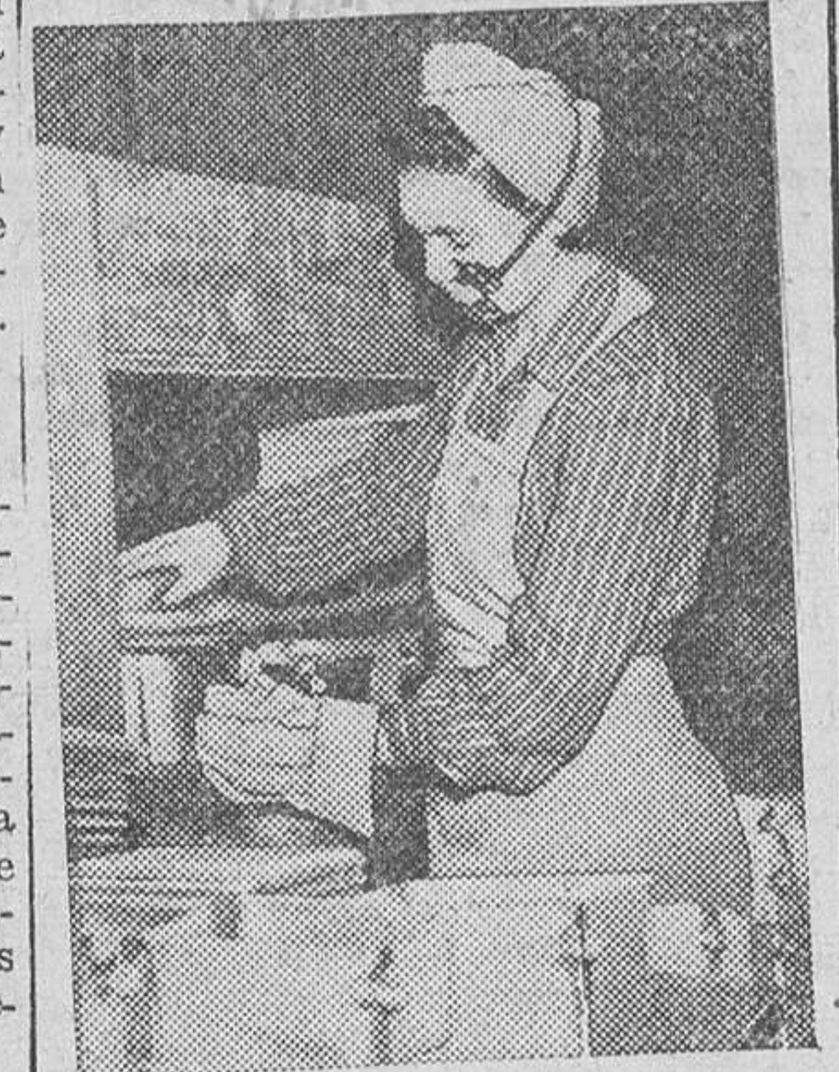
Finalizada la cantienda mundial una gran factoria inglesa de aviones ha sido habilitada para producir utensilios domésticos. He aquí a una obrera entregada a la fabricación de cacerolas.