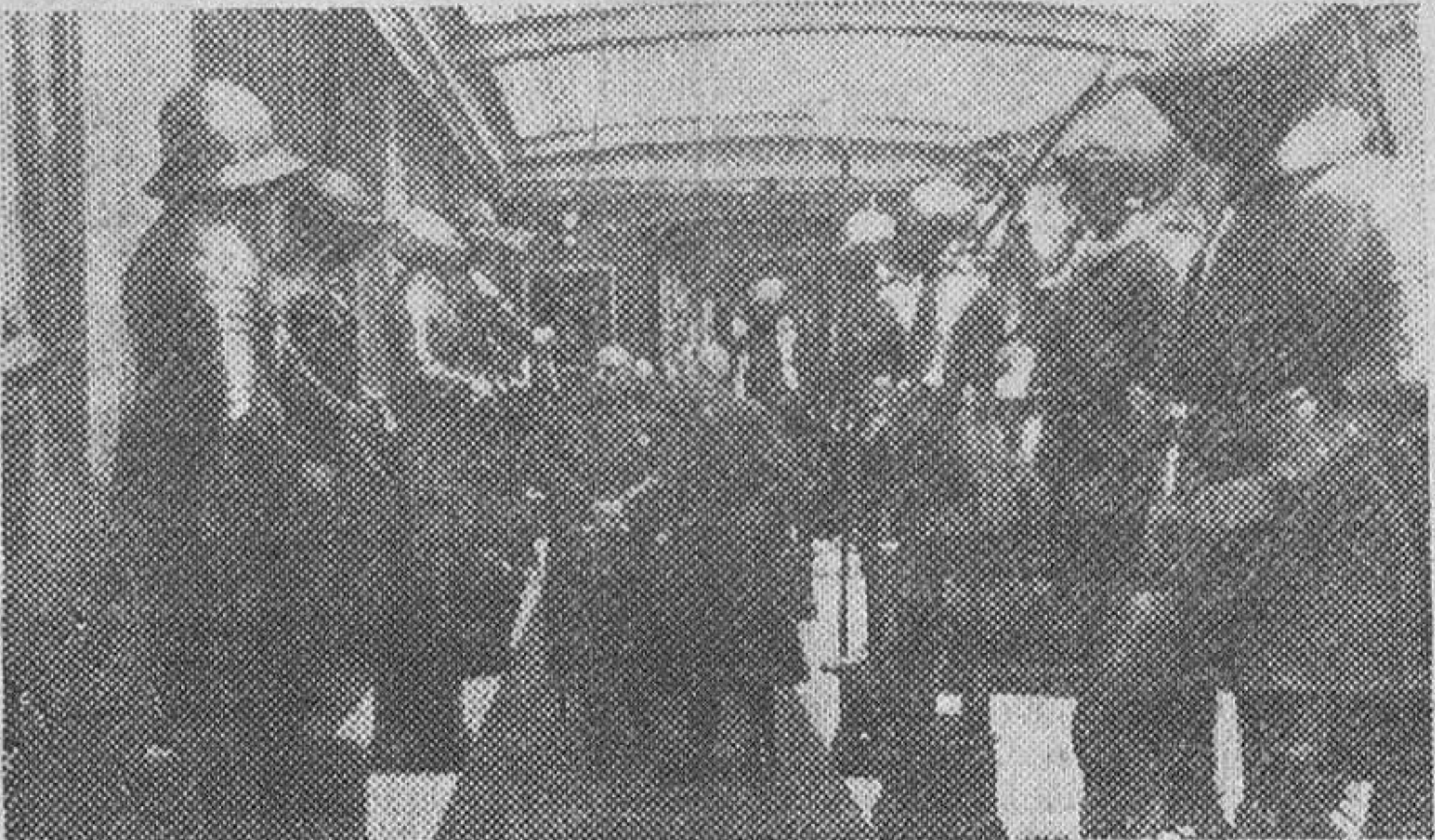
Madrid.— El Caudillo, inaugura las nuevas salas del Museo del Ejército, acompañado de altos jefes militares y los agregados de las Embajadas extranjeras. El Jefe del Estado visitó al propio tiempo las diversas salas y más tarde, pronunció un importante discurso