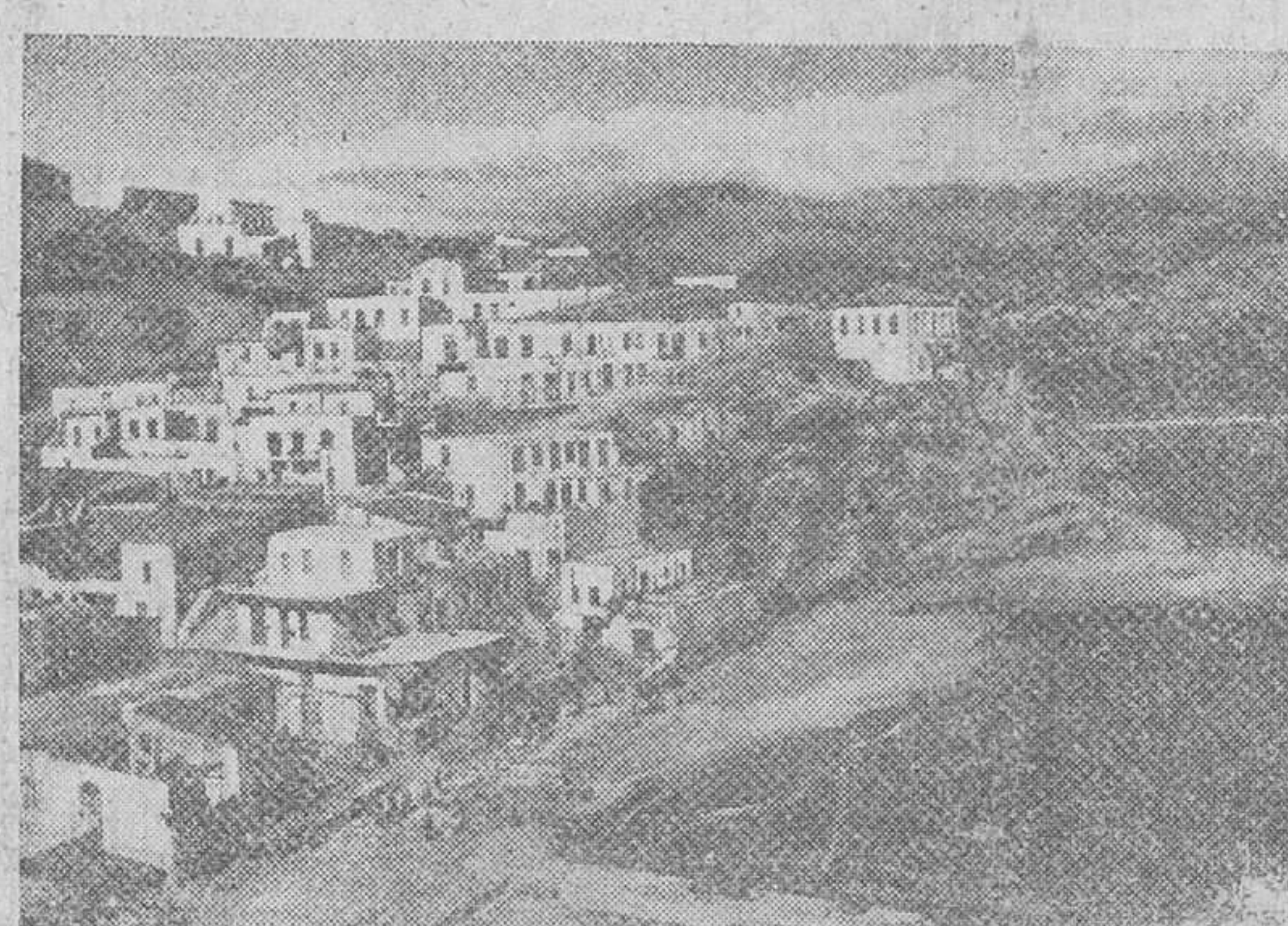
He aquí un bello fotograma de una pequeña ciudad situada en la costa de la isla de Creta, donde la vida civil ha vuelto a la normalidad tras el cese de las hostilidades