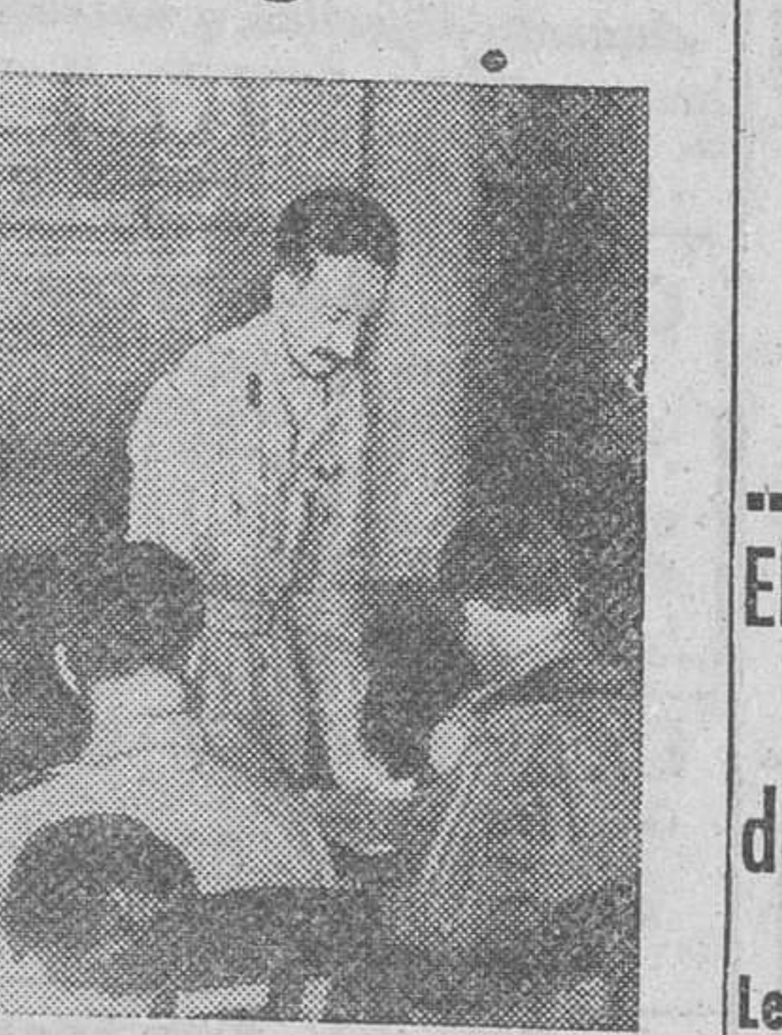
La firma de las condiciones preliminares de la rendición de Rangún. Firmaron por parte japonesa el general Takaso Numata y el almirante Kalgue Chudo.