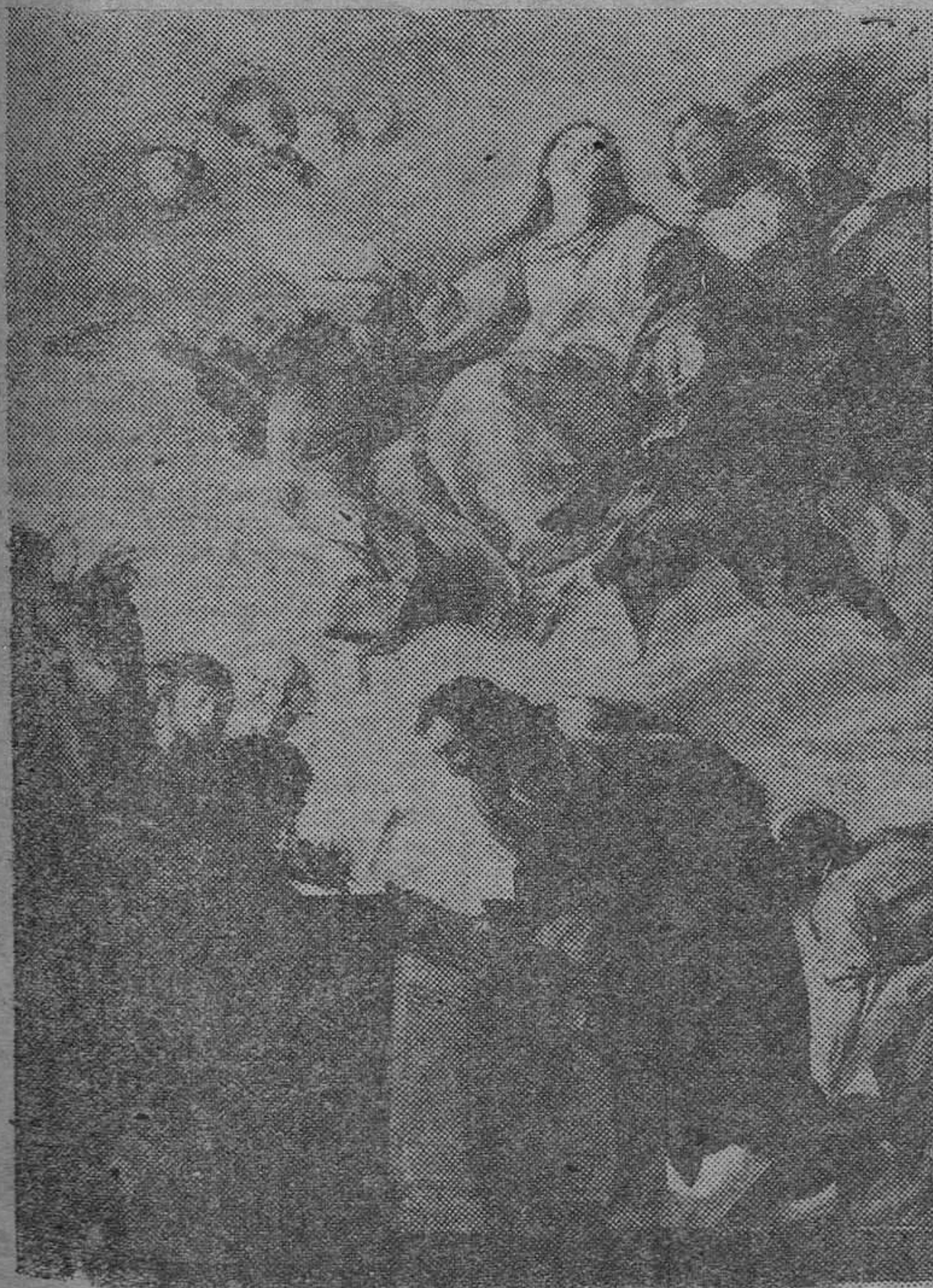
Quince de Agosto. Día de la Asunción de la Virgen. Cuadro de Cerezo que figura en el Museo del Prado

En esta época del año cristiano la de los cielos claros, diafanos, que parecen de diluido oriente de penla, hay unos días en que todos los pueblos de España, en sus ciudades, en sus aldeas, en sus villas, por humildes que sean, a orilla del mar, o en la montaña, siguen fervorosamente el vuelo de