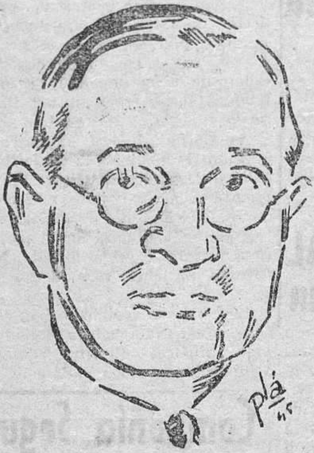
Mr. HARRY S. TRUMAN

Washington.—En su alocución radiada dirigida a las fuerzas armadas norteamericanas en todas las partes del mundo, el presidente Truman, dijo: